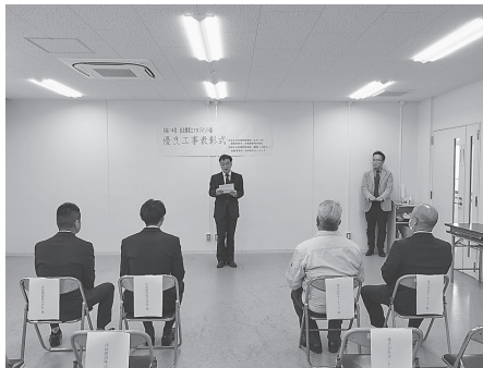
表彰式の様子(11月18日、中和土木事務所)