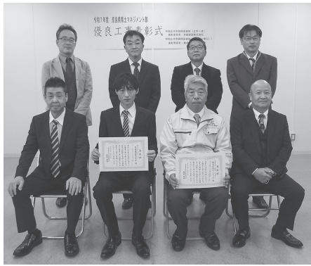
表彰式後の記念撮影

トの打ち継ぎや養生でのひび割れ対策を必要とする工事でした。そうした中、打ち継ぎ目のひび割れ対策として水平鉛直方向ともレイタンス処理剤を使用するなど均質な打ち継ぎ網の確保に努めて頂いた。また、養生では残存型枠を湿潤状態にするなどコンクリートの温度変化を緩やかにす