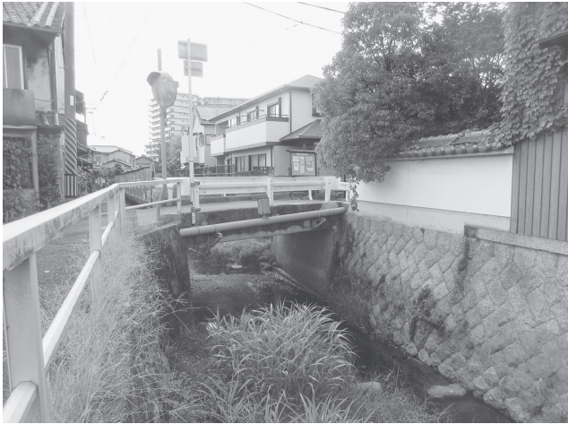
架替が計画される橋梁

整備は南部中核拠点の核となるコアゾーンとして防災拠点となる施設及び消防学校の整備を16年度までに進めて防災機能を向上させ、第3段階の支援ゾーン整備では近隣府県等の応援部隊を受け入れるベースキャンプと外周道路等を整備して更に防災機能を向上させる。