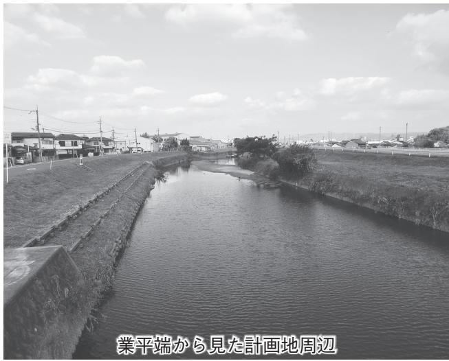
業平端から見た計画地周辺