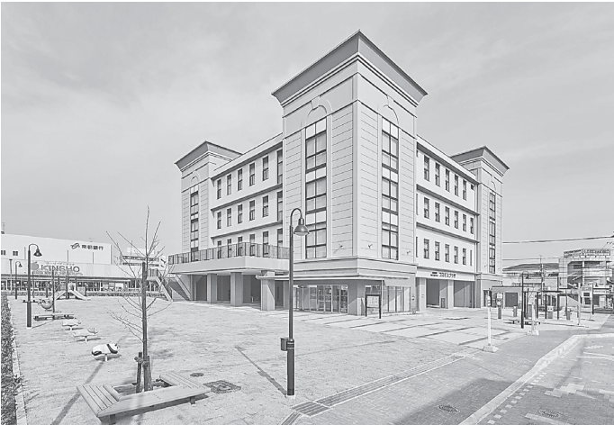
市民交流センター外観