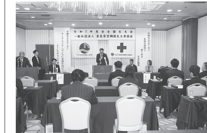
奈良市内で開かれた安全衛生大会

奈良県空調衛生工業協会は11日午後、奈良市法華寺町の奈良ロイヤルホテルで令和7年度安全衛生大会を開いた。労働安全スローガン「多様な仲間と、築く安全未来の職場」、労働衛生スローガン「ワーク・ライフ・バランスに意識を向けてストレスチェックで健康職場」の重要性を共有し、安全衛生管理活動を組織的、計画的、継続的、安定的に進め、労働災害を防止するための体制の確立を図る。