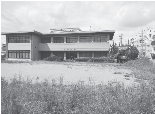
移転先に決まった旧中和労働会館

40年が経過して施設が老朽化、児童虐待相談対応件数の増加に伴って対応する職員数が平成29年当時から約2倍となり執務スペースが狭小であることから、令和6年度に新設移転(一時保護所併設)を決定している。