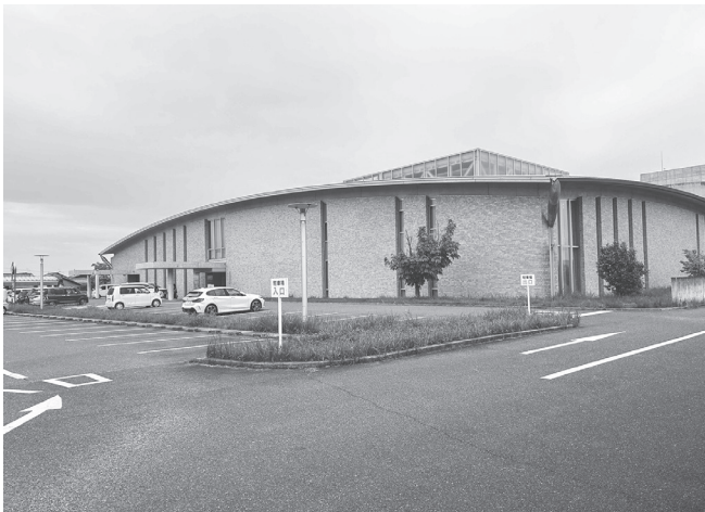
青垣生涯学習センター

000万円の費用がかかる。これは、これまでの維持等に係る予算の実績値2億7000万円の4・4倍に当たることを示している。 現状を維持することは、おおよそ困難であり機能が重複する施設