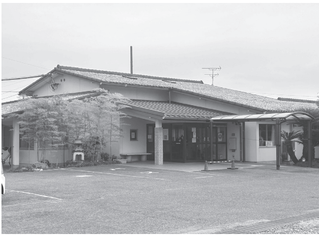
老人福祉センター

田原本町は「田原本町老人福祉センター廃止と代替施設の機能再編」について、パブリックコメントを実施する。意見の募集は10月23日までで、郵送またはFAX、電子メール、持参で受け付ける。提出先は長寿介護課(電話0744-33-8220)。 老人福祉センター廃止後は、ふれあいセンターや青垣生涯学習センター、さわやか交流センターなどの既存の公共施設へ老人福祉センターの機能を集約する予定。各施設については規制を緩和し、利便性を向上。移動手段は、デマンド交通を大幅に拡充するとともに、マイクロバスの運用を引き続き行う予定。なお、老人福祉センターの廃止後は、民間資金を活用した子育て施設などとしてのリニューアルをすることにも検討している。 町の「公共施設等総合管理計画」においては、公共施設を現在の施設規模のまま長寿命化(維持)をした場合、今後、年平均で11億9000万円の費用がかかる。これは、これまでの維持等に係る予算の実績値2億7000万円の4・4倍に当たることを示している。 現状を維持することは、おおよそ困難であり機能が重複する施設