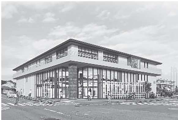
(仮称) 當麻複合施設(イメージ)

葛城市が去る8日開札した一般競争入札「(仮称) 當麻複合施設整備工事」は森組が23億8000万円(予定価格24億4500万円)で落札した。参加は森組のみ。 工期9年1月29日 工事場所は竹内。工事は概要は既存の當麻文化会館を全面改修する。建築工房・福本設計JVが担当。工期9年1月29日。