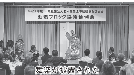
舞楽が披露された