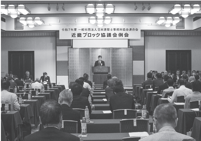
盛大に開催した近畿ブロック協議会例会＝12日、奈良ホテル