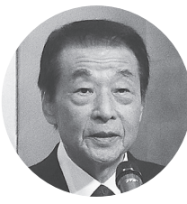
原田近畿ブロック協議会会長