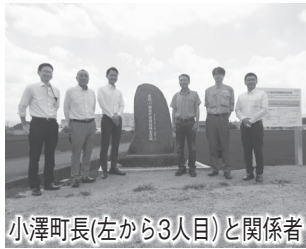
小澤町長(左から3人目)と関係者