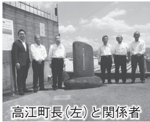
高江町長(左)と関係者