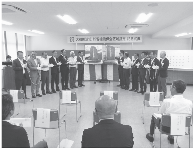
リモートによる除幕式=8月7日、県中和土木事務所

高江町長は「古くから水害に悩まされ対策を進めてきた。地権者の皆様の理解とご協力により、全国初認定の治水機能保全区域に指定されたことに大変に喜ばしい。式典後は唐院(イ)地区貯留機能保全区域と西代(イ)地区貯留機能保全区域にそれぞれ建立された区域指定看板と記念碑を見学、現地説明も行われた。