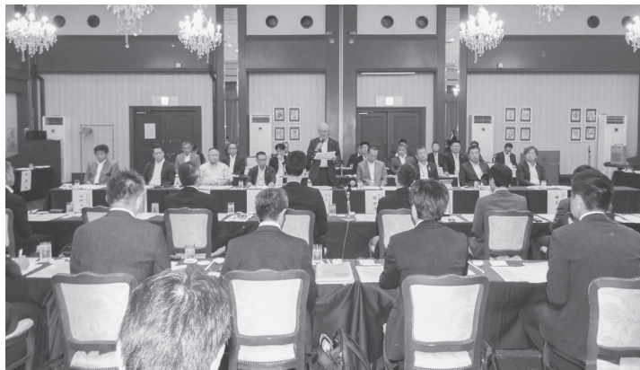
3日に開かれた意見交換会=奈良ロイヤルホテル

近畿地方整備局と奈良県建設業協会(山辺元康会長)による意見交換会が3日、奈良市法華寺町の奈良ロイヤルホテルで開かれた。公共工事における諸課題について、受注者と発注者が合同で課題解決に向けた取り組みを行うことが目的。 協会は▽奈良県のインフラ整備の促進▽地元建設企業に対する受注機会の拡大▽入札・契約制度等▽設計・積算▽地方公共団体への指導等▽工事施工▽現場環境をより良くする取り組み▽営繕(建築)など8項目について要望し、活発な意見交換が行われた。(詳細は後日掲載)