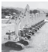
凡ゆる建設機械を取り揃えています。お近くの営業所までご相談下さい。

インターネットでの検索、下見等お気軽にご連絡下さい。 https://www.daiki-net.jp