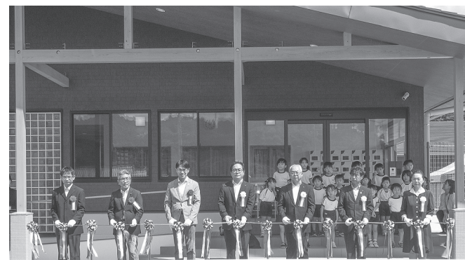
大淀町子育て支援拠点施設「未来樹」オープニングテープカットセレモニー

同施設は、敷地面積4801.48平方メートルにW造平屋建、延床面積1660.08平方メートルの規模。設計は総企画設計、施工は森下組がそれぞれ担当した。現在の町立第一保育所と町立あおぞら保育所を一つの認定こども園(みくろ)に再編。発達支援室(カラフル)、地域子育て支援センター(めばえ)、病後児保育室(にじ)を併設、4つの機能を集約した。11月に開設予定(病後児保育室は来年4月開設予定)。