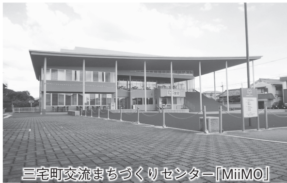
三宅町交流まちづくりセンター「MiMo」