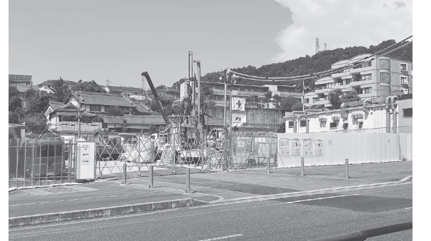
建設地(東菜畑1丁目293番2)

積水ハウスの施工で 東菜畑に生活介護事業所を建築 地域の障害者やその家族が安心して暮らせるようなサポートを多方面において展開している社会福祉法人青葉仁会(奈良市杣ノ川町50-1)は、生駒市東菜畑に「社会福祉法人青葉仁会 東菜畑」を計画。設計・施工は積水ハウス奈良シャームゾン営業所が担当して