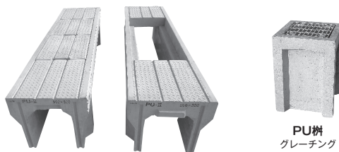
PU-II可変側溝 NSスリット付

〒636-0216 奈良県磯城郡三宅町小柳148 TEL0745-44-4112 FAX0745-43-0606