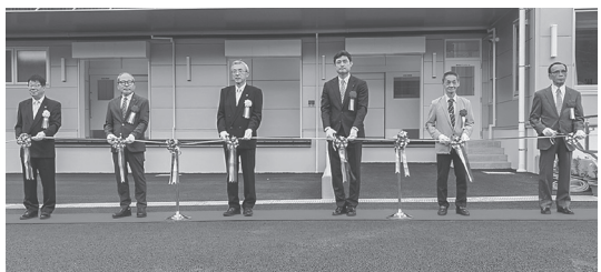
金剛市長(左から3人目)ら関係者でテープカット