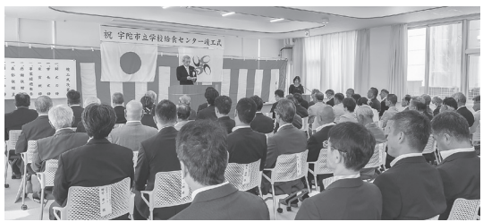
盛大に行われた竣工式=7月31日

長就任直後に移転先が決まり4年が経過した。ようやく念願であった給食センターが完成した」と地域関係者や工事関係者らに感謝の意を述べた後、「安全安心な給食の提供はもとより、地産地消の推進と給食費無償化もスタートする。幼稚園や保育園、こども園までの無償化は県内12市では初となる。子ども真ん中社会の実現を目指し、食育の拠点として健康経営に取り組みたい」と式辞を述べた。