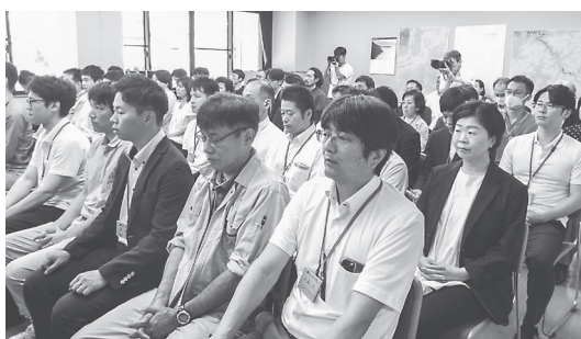
訓示を受ける職員ら