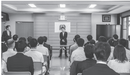
職員ら約60人に訓示