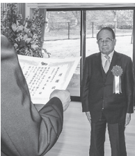
藤本建設(藤本会長)