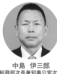
中島 伊三郎 総務部次長兼知事公室次長