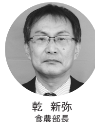
乾 新弥 食農部長