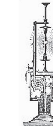
デュボスク式アーク灯

明治11年(1878年)3月25日、明治政府工部省電信局は、万国電信連合に加盟する準備として、東京・木挽町に電信中央局を設け、その開局祝賀会を東京・虎ノ門の工部大学校(現東京大学工学部)の講堂で開催しました。