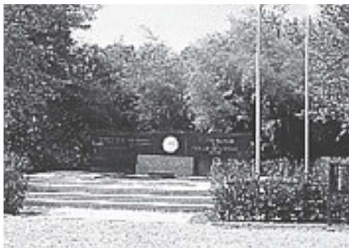
エジソン記念碑(京都石清水八幡宮境内)

動力への利用は電灯よりも少し遅れ、明治23年(1890年)11月に東京・浅草の凌雲閣(12階)のエレベーター運転用として、7馬力電動機に供給されたのが初めてであり、また明治28年(1895年)2月には、京都の伏見線で電気鉄道が初めて走り始めました。