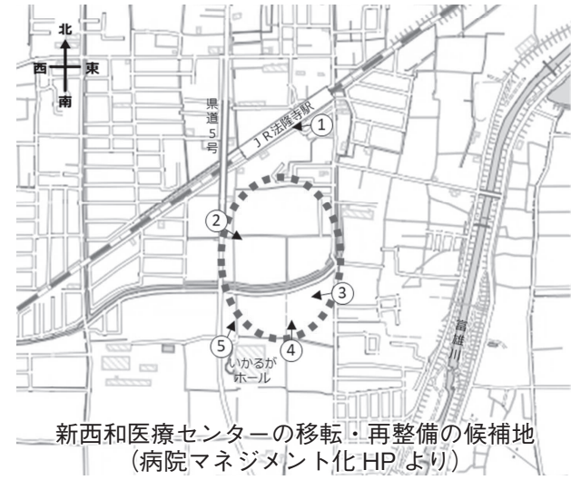
新西和医療センターの移転・再整備の候補地(病院マネジメント化HPより)

若者の未来への責任」 ▽ぬくもりあふれる公園プロジェクト(1億7800万円) ▽6年度10年度の5年間で公園機能を拡充する県営都市公園の施設・設備の整備を実施。 ▽まほろば健康パーク(1400万円、7年度債務負担行為2700万円) ▽障害のある人もない人もすべての人が利用できるインクルーシブ公園の検討。 ▽県立高校トイレ環境改善(2億7600万円) ▽6年度10年度の5年間でトイレ洋式化・乾式化等工事。6年度は全校で設計。 【豊かで活力ある奈良県を創る責任】 ▽脱炭素・水素社会の実現(9億3700万円、2月補正5億円)。 ▽用地確保と先進的なグリーン化(10億7400万円、7年度債務負担行為2億4900万円) ▽京奈和自動車道御所IC周辺に工業団地を整備など。 ▽大和平野中央の県有地の活用(12億4200万円) ▽磯城郡3町における県有地を活用したまちづくりで①