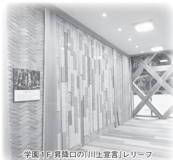
学園1F 昇降口の「川上宣言」レリーフ