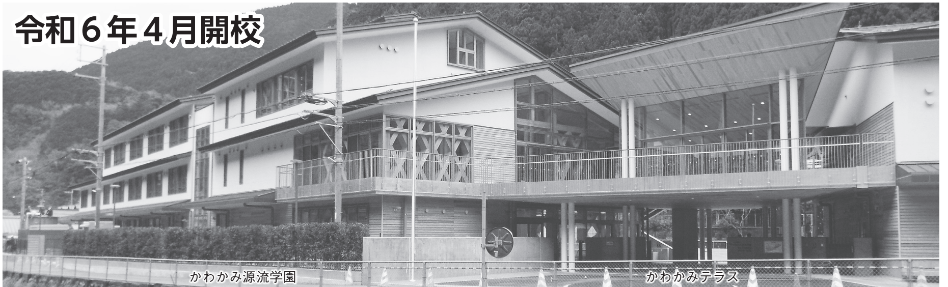
かわかみ源流学園