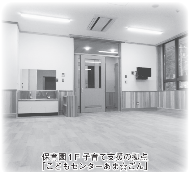
保育園1F 子育て支援の拠点「こどもセンターあま☆ごん」