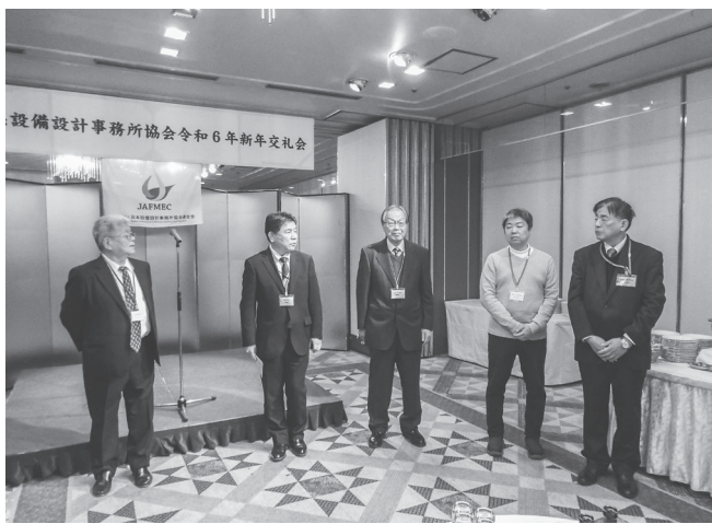
正会員の紹介も行われた

近畿)は、「賛助会あげて技術的な一助になれるように努めたい」。懇親会に移り藤原会長は「4月から働き方改革推進のための時間外規制の制約が適用されます。担い手が少ない業界にあつて、脱却できるように努めてまいりたい」と乾杯を発声し開宴。和やかな雰囲気の下、親睦を深めた。