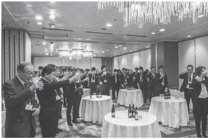
新春に更なる発展を誓った(24日、奈良ロイヤルホテル)