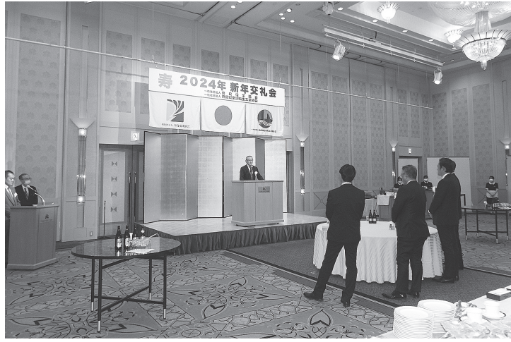
盛大に開かれた賀詞交歓会(15日、ホテル日航奈良)

賀詞交歓会には、山下真知事をはじめ、清水将之県土マネジメント部部长、谷垣孝彦地域デザイン推進局長ら関係者のほか、