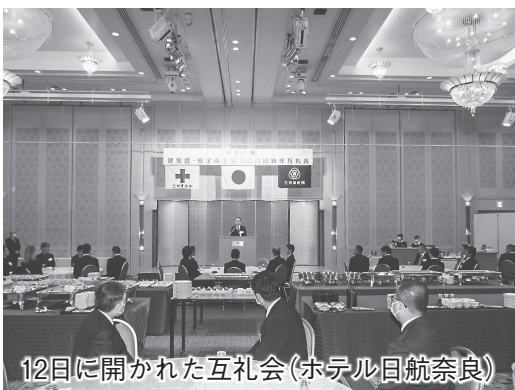
12日に開かれた互礼会(ホテル日航奈良)