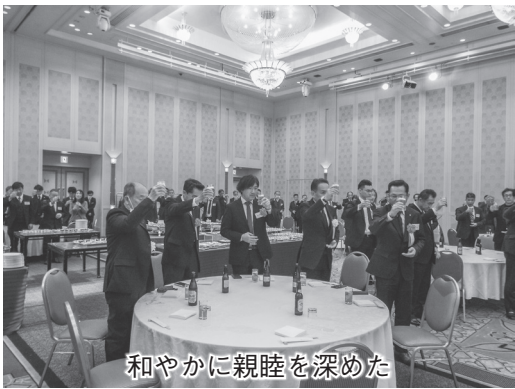
和やかに親睦を深めた

宮坂会長は「安全第一で作業するは当然だが、安全を保つには体と心の健康が求められる。『健康心』で良いパフォーマンスができるように共に成長し