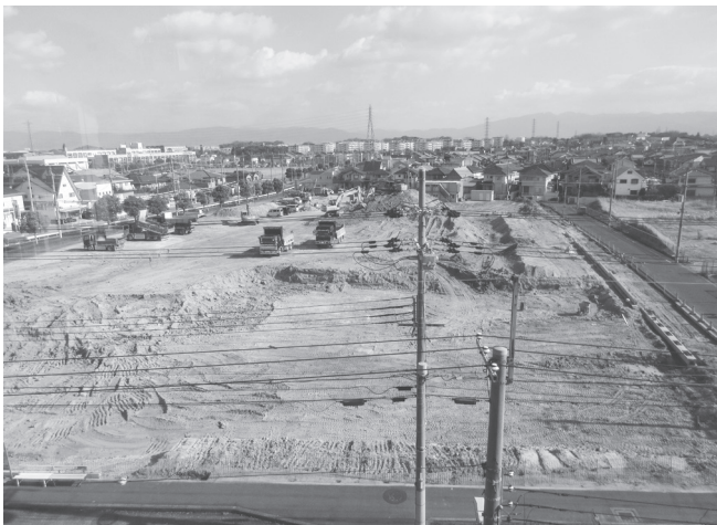
出店予定地では開発工事が進む(左に中和幹線)