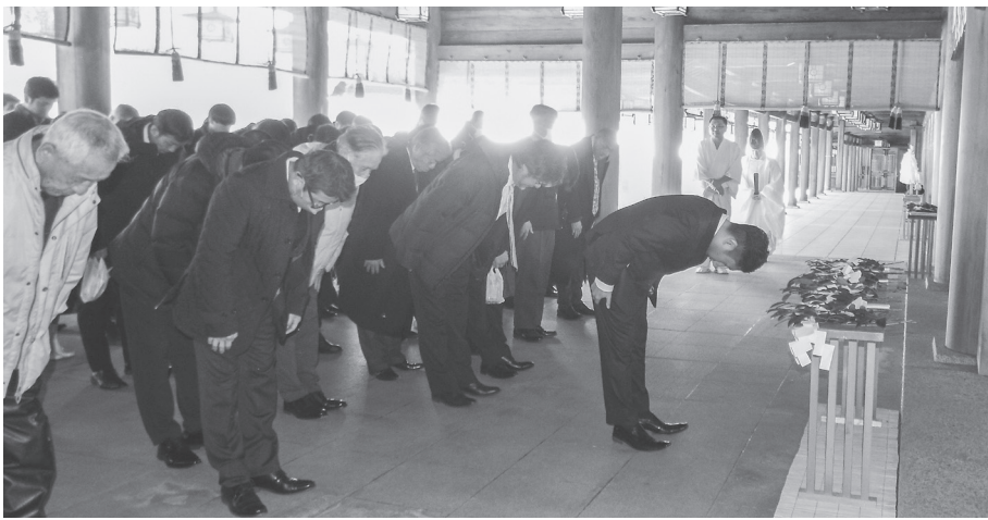
新春初神楽祈禱(上)、内拝殿(下)にて無事故無災害と事業の発展・繁栄を祈願した(5日、檀原神宮)