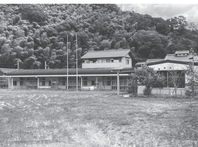
大淀西部幼稚園 (今木 779-4)

今回の調査では、事業者のノウハウを發揮した事業アイデアに関する提案(①実施する事業の内容、整備する施設の内容等)に関する提案(②施設及び機能の概要・規模等)③事業方式に関する提案(④購入・貸借・その他の管理運営方法)⑤既存施設の活用に関する提案(⑥再利用、取壊し、新築等)⑦町の施策の方向性を踏まえた提案(⑧地域貢献、今木区有地の一体活用の可能性等)、避難所利用への対応について、事業の実施にあたり想定される課題に関する提案、その他、事業期間や諸条件など本事業全般に関する意見・要望。