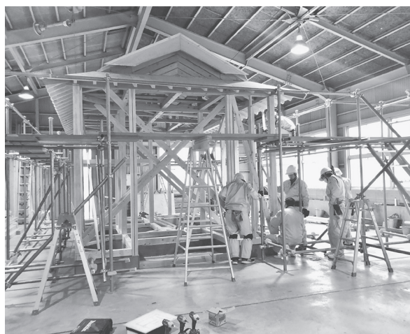
建築中の屋根付一軒家

また、親子で体験できるカンナ削りコーナーなど、新卒者や求職者だけでなく、近隣市町村民やファミリー層も楽しめるようになっている。ものづくりならではの、木製のおもちゃづくりで「もの」の大切さに触れられる。同展の目的については、「各学科の訓練内容は、