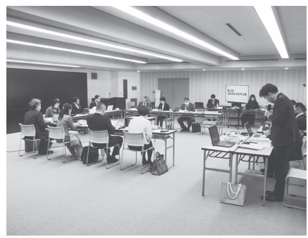
様々な意見が述べられた(11月27日、生駒庁舎にて)

園児の安全確保第一に 認定こども園に移設するにあたり、施設や職員員の拡充は必須。在園している園児の保育を継続しつつ、法人が国庫等補助を得て行うには全面建替が不可欠と考えられている。定員は今後検討を行う必要があるが、0歳児5歳児合計190人程度を想定している。