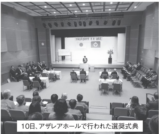
10日、アザレアホールで行われた選奨式典