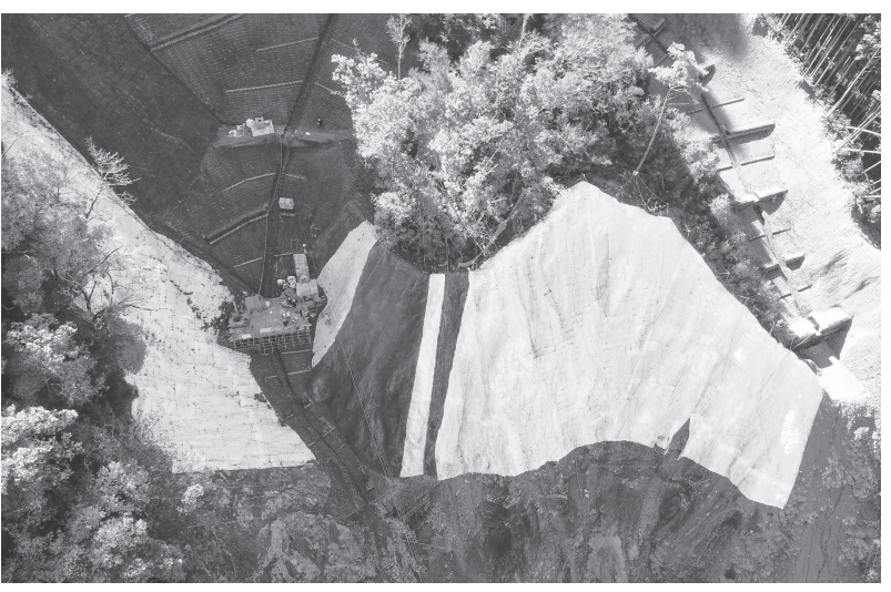
●内野山腹工事/十津川村内野