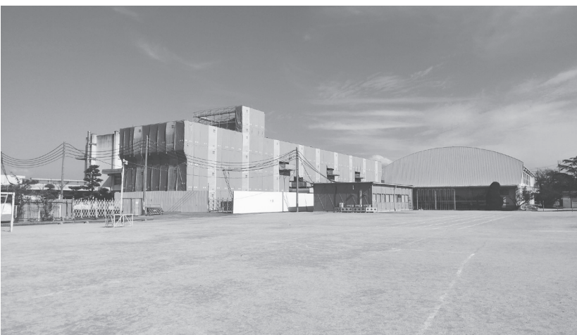
長寿命化工事の進む「真菅北小学校」

インフラ面では、令和6年度中の完成を目指すしている奈良県立医大新キャンパスの整備に伴い、周辺地区の整備としてアクセス道となる市道の新設や拡幅が進められているほか、国道24号十市橋北詰交差点付近の渋滞緩和などを目的に進められている。「十市町4号線」の延長約100メートルの整備も予定されている。また、「西新堂跨線橋補修・補強工事」を始めとした橋梁や、傷んだ道路舗装の更新といった維持管理なども推進される。