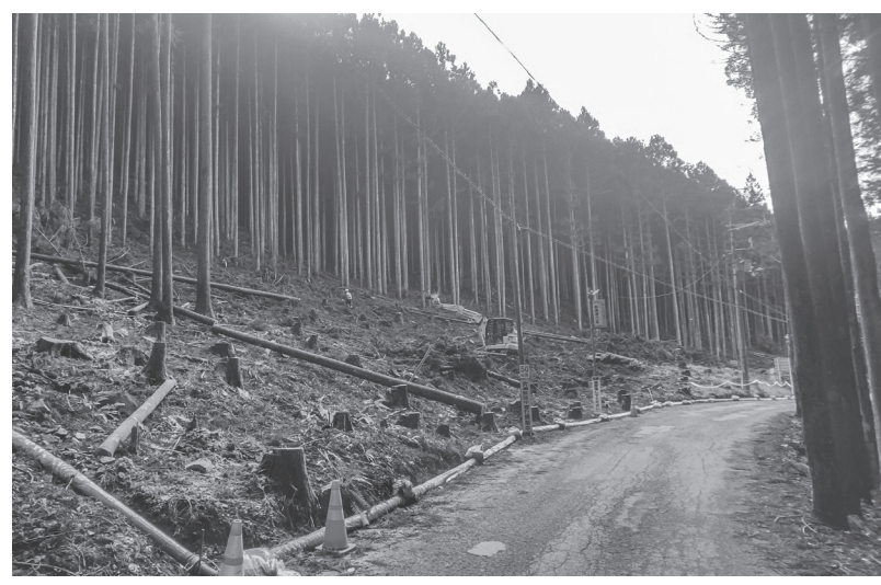
●主要地方道大峯山公園線蛇之倉工区道路改良工事/天川村洞川

土木の日の由来 土木の2文字を分解すると十一と十八になることと、土木学会の前身である「工学会」の創立が明治12年(1879)11月18日であることから、11月18日を「土木の日」と制定しました。