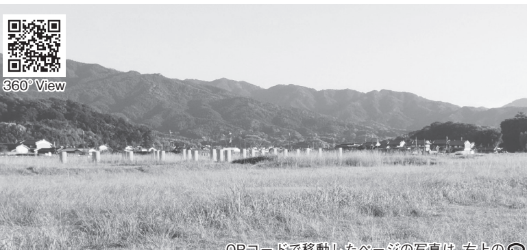
QRコードで移動したページの写真は、右上のクリックで360° Viewがご覧いただけます。