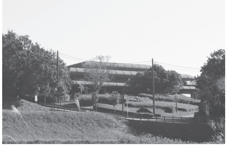
9月に事業契約が締結された「橿原市営斎場」

その中で、かねてより耐震強度の不足が問題となっており、市長選でも争点となった本庁舎の建て替えは、民間活力を導入した形で、現地での建て替えの方向で検討をスタートさせる。複合施設と