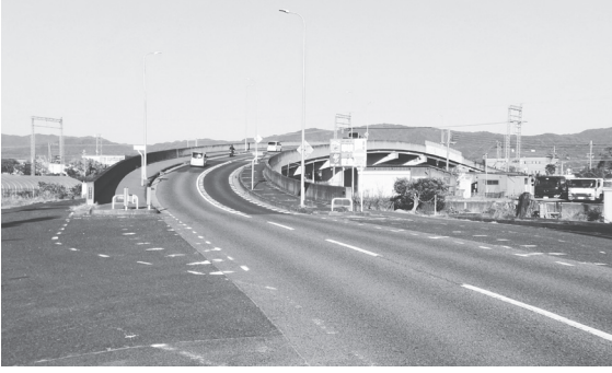
耐震と改修を進める「西新堂跨線橋」