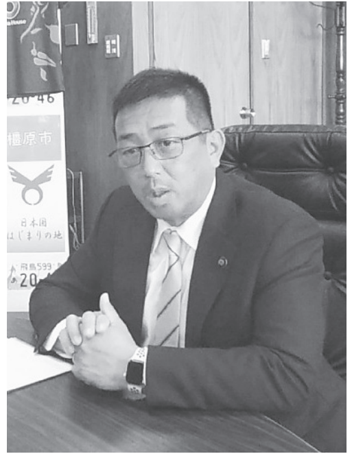
檀原市長 亀田忠彦氏

現職として4年間市長を務めた亀田忠彦氏は、任期満了に伴い10月22日に行われた檀原市長選で元職の森下豊氏を破り再選を果たした。市役所本庁舎の建設などを争点に行われた選挙戦で有権者の信任を得た形となり、13日に初登庁した。亀田市長に2期目に当たっての抱負、今後の方針などを伺った。