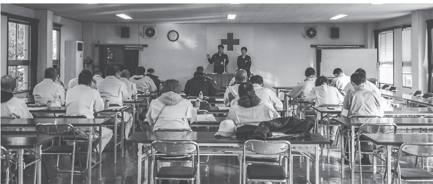
安全講習では、働き方改革などの解説が行なわれた

安全講習では、働き方改革などの解説が行なわれた。安全講習では、働き方改革などの解説が行なわれた。安全講習では、働き方改革などの解説が行なわれた。