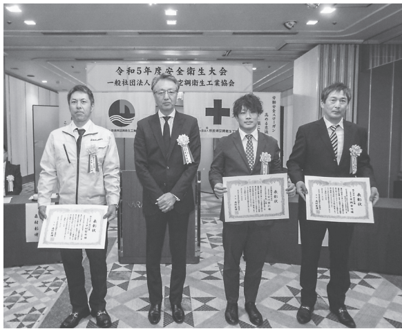
森村会長(左から2人目)を囲んで記念撮影する受賞者