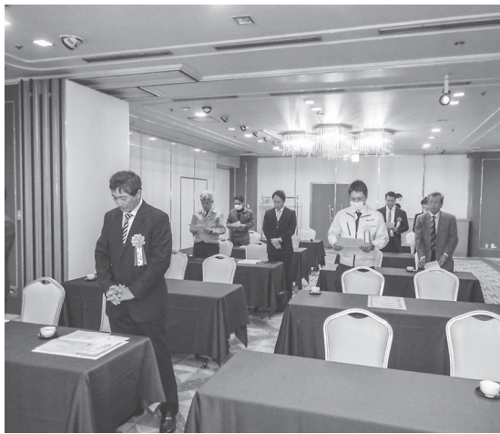
安全宣言を唱和する参加者

その後、令和3年度をもって計画期間終了を迎える交通網形成計画に関する評価・検証を行うとともに、令和4年度から計画期間とする「広陵町地域公共交通計画」を策定。交通計画策定に当たり、広陵町地域公共交通活性化協議会を開催