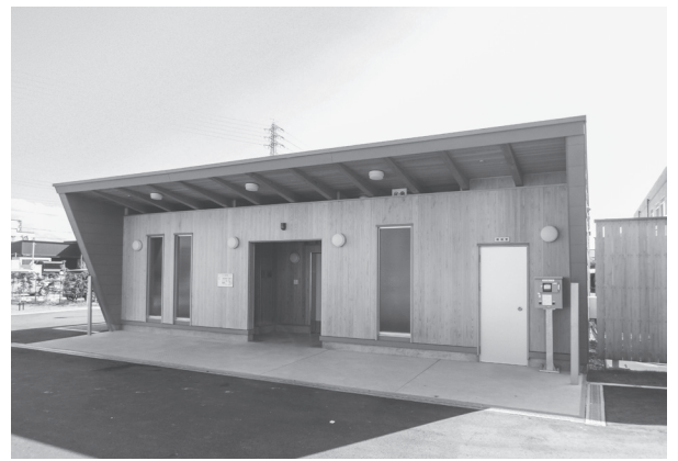
明るく子供らにも使いやすいトイレを整備