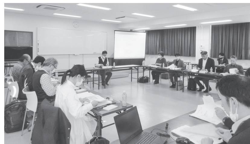
とりまとめへ向け議論した

第104回奈良県河川整備委員会(委員長・川池健司京都大学防災研究所教授)を、さる31日に県郡山総合庁舎(大和郡山市満願寺町60-1)で開催し、大