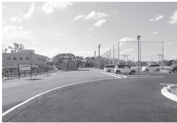
駐車場から公園方面への通路