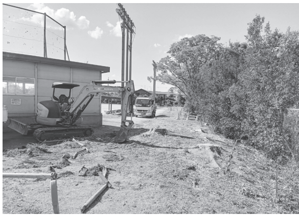
引続き公園リニューアル工事を進める