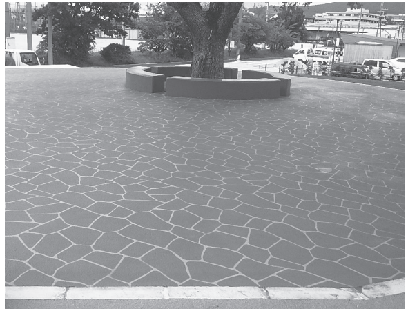
公園の高台には薄層カラー舗装を施し安全性を高めた

奈良市は、かねてより整備を進めていた「柏木公園キッズパーク」(同市柏木町)がこのほど完成、これまでの柏木公園をリニューアルし、明るく子供らが集う広がりのある空間に生まれかわった。10月3日オープンしたが、先行して9月末からすでに開放しており、日々、大勢の家族連れで賑わっている。