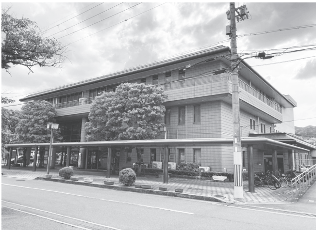
複合施設となる葛麻文化会館

葛城市は、「(仮称)葛城市葛麻複合施設管理・運営基本方針」を策定した。同市では、葛麻庁舎の再配置にあたり、新庁舎の更新を迎える時点で基本的には庁舎を一つとする