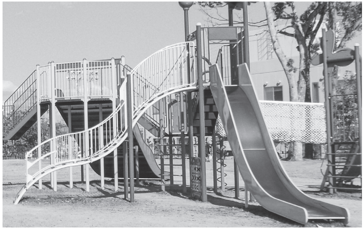
安全に配慮した大型複合遊具を設置した

奈良市は、かねてより整備を進めていた「柏木公園キッズパーク」(同市柏木町)がこのほど完成、これまでの柏木公園をリニューアルし、明るく子供らが集う広がりのある空間に生まれかわった。10月3日オープンしたが、先行して9月末からすでに開放しており、日々、大勢の家族連れで賑わっている。