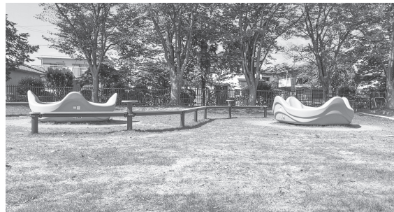
インクルーシブ遊具のオムニスピナーを二基配置

完成したキッズパークは、遊具広場(敷地面積約4900平方メートル)にネットクライミング(高さ約6メートル、高さ約8メートル各1基)や大型複合遊具を設置。インクルーシブ遊具(障がいのある方でも一緒に遊べる遊具)のオムニスピナーを2基配置する他、樹木植樹、照明設置、園路整備、駐車場も改修、更に公園やグラウンドに近い南側駐車場を整備するなど利便性を高めた。公園の高台には薄層カラー舗装を施し安全性にも配慮。トイレはおむつの取替台なども設置した。