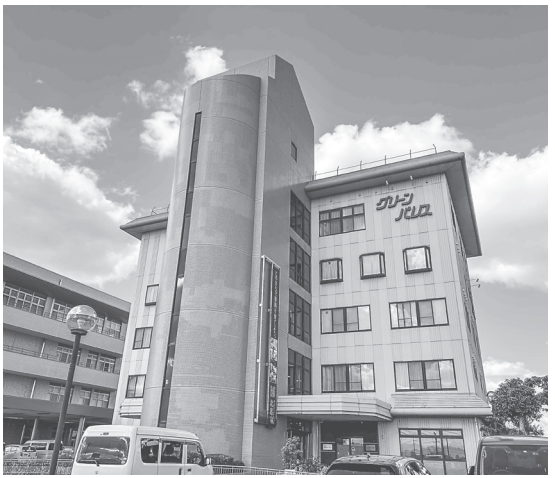
ふるさと会館グリーンパレス(大字笠 168番地)

平群町清掃センターは椿井1737番地に位置し、RC造及びS造延べ床面積1310.96平方メートル(工場棟、205.76平方メートル(車庫棟)。機械化バッチ燃焼式焼却炉で定格処理能力は35t/8h(17.5t/8h×2)の通り。主な工事範囲は次の通り。