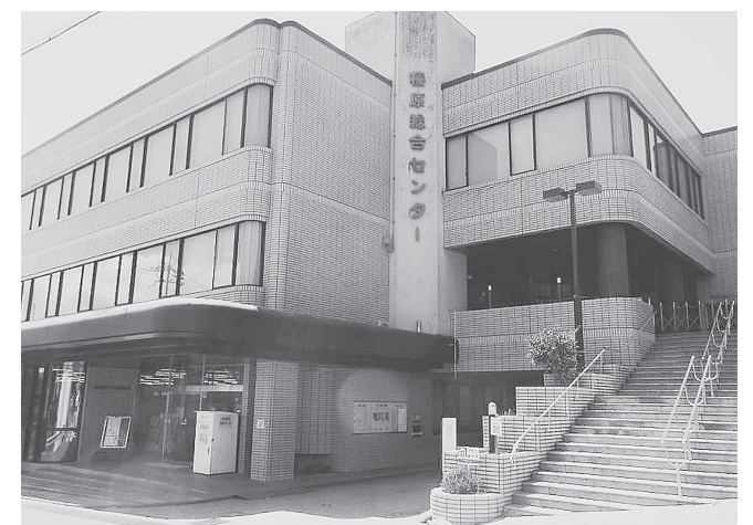
榛原総合センター

宇陀市が10月20日開札した一般競争入札「第05-A039号棟原総合センター利用促進事業宇陀市榛原総合センター改修工事」は松塚建設が1億3000万円(予定価格1億3437万円)で落札した。参加は松塚建設のみ。