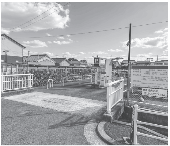
箸尾駅前駐車場・駐輪場(大字萱野 330番地・325番地)