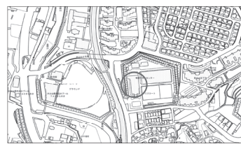
竜田川浄化センター

情報をもとにWebサーバ機能で現在状態の閲覧履歴、システムデータの任意設定、ログイン時のユーザー認証機能等のサービスの提供が可能であることが条件。