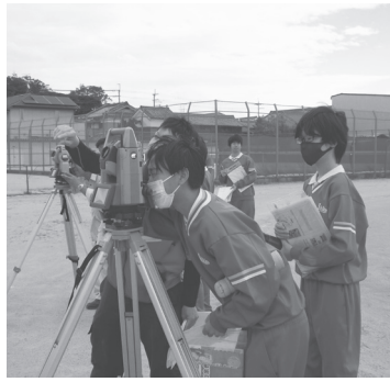
高さトランシットコーナー