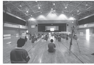
来春卒業する第75期の3年生を対象に行なわれた測量体験(10月20日)

興味を持ってもらえれば」と期待を寄せた。中本校長は、「第75期卒業生の記念行事として測量体験を」と協会にお話をしたところ快く承諾して頂いた。しっかりと測量について勉強し、知識を広めて欲しい」と話した。