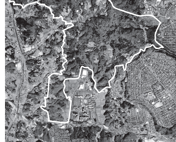
学研高山地区第2工区

参加資格は▽公告日から受託候補者特定の日まで、同市の入札参加停止措置要領による入札参加停止を受けていないこと▽地方自治法施行令第167条の4第1項の規定に該当しないこと▽会社更生法または民事再生法に基づき更生・再生手続き開始の申立てをしていないこと。ただし、会社更生法の規定による更生計画または民事再生法の規定による再生計画について、裁判所の認可決定を受けた者を除く。など。