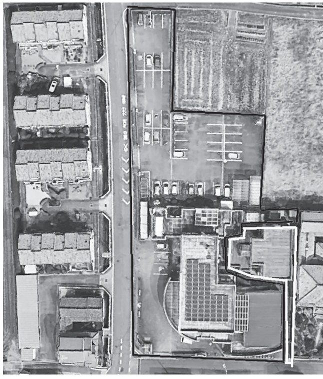
ふれあいセンター（大字為川北方115番地の6）

田原本町は「田原本町ふれあいセンター」の指定管理者を再募集している。申請書類の受付期間が10月31日まで、書類審査による1次審査を11月上旬頃、面接審査による第2次審査を11月中旬頃に実施し、12月議会後に指定管理者を指定し協定締結する予定。指定管理料の上限は令和6年度～8年度の各会計年度あたり4500万円