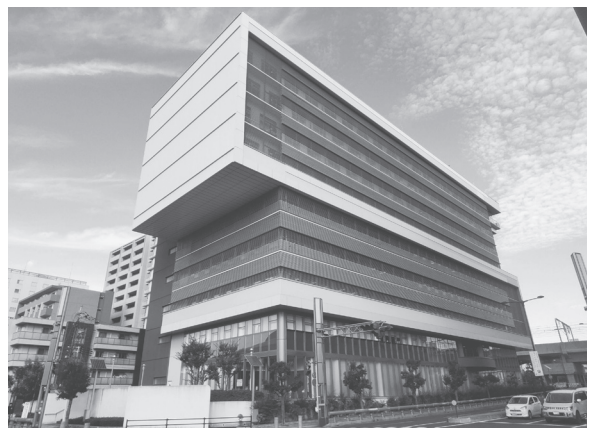
照明LED化を進める奈良市保健所・教育総合センター(上)、なら工芸館(下)