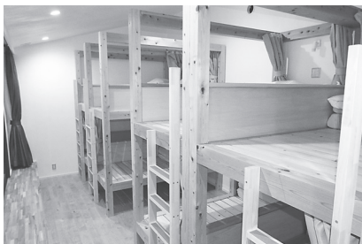
ドミトリー形式の10人部屋