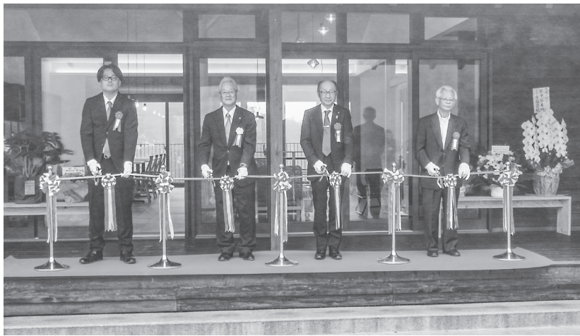
山室村長(左から2人目)らで待望のテープカット=1日、WASAMATA HUTTE 上北山村西原