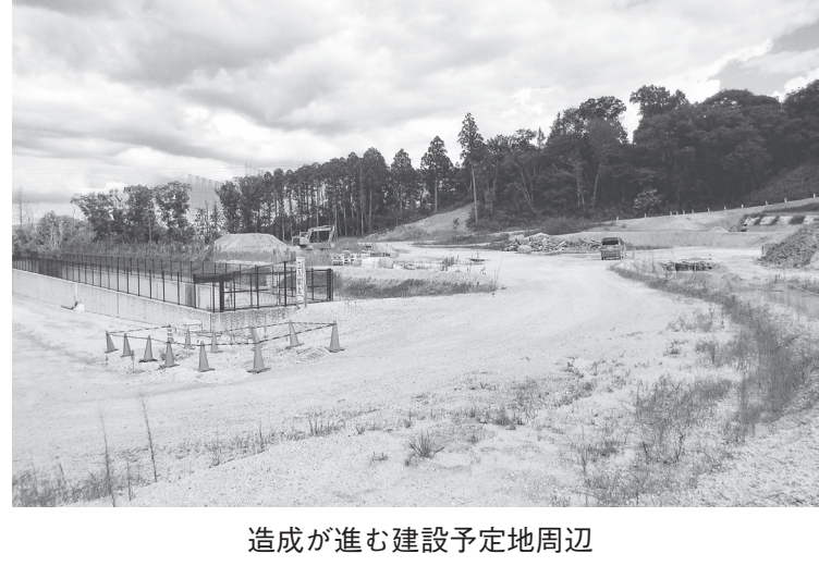
造成が進む建設予定地周辺

インサルトンツが担当。工期7年9月30日。設計金額19億934万9200円込、最低制限価格は設定あり。 5年度当初予算には香芝市スポーツ公園整備事業(プール整備)として8億5540万円を計上しており、ス 進めるとともに、プール施設の建設工事を実施するとしている。プール施設建築工事費(監理費含む)19億5000万円、このうち5年度予算3億3000万円。担当課は都市創造部土木課(電話0745-44-3317)。 施設は屋内温水プール25メートル×8メートルと小プール(水面積6メートル×10メートル)、屋外レジャー プールの流水プール(水面積432平方メートル)とキッズプール(水面積91平方メートルと遊具付47平方メートルの計138平方メートル)。 香芝市スポーツ公園は、基本計画を13年3月に策定し、15年3月に修正を行っている。計画地は平野・今泉。敷地面積23.7畝を都市計画公園として計画に北側の都市計画道路 尼寺関屋線と畑分川線に囲まれた旧特定保留区域2.8ヘクタを追加し、南側の自然公園特別地域内の山林部分4.6畝を除外した範囲21.9畝とする計画に変更。施設整備計画は▽多目的競技場2.5畝▽多目的広場1.6畝▽テニスコート0.7畝▽武道館0.7畝▽プール1.1畝▽軽スポーツ施設▽健康づくり施設。(吹上)