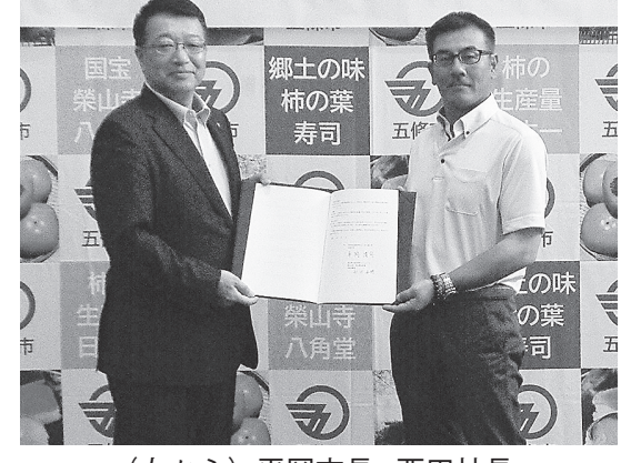
(左から) 平岡市長、西田社長