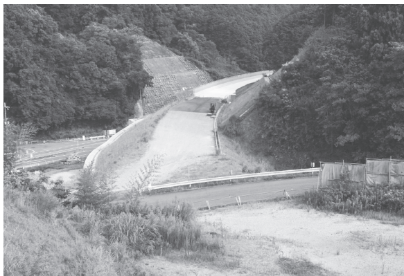
工事用道路となっていた本線の一部も取付工事が予定されている