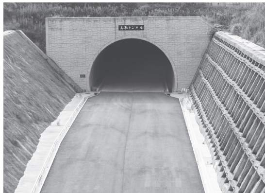
照明設備など、内部の整備に取り掛かる高取トンネル