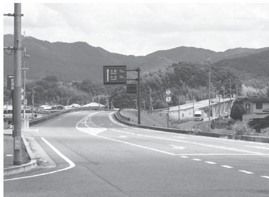
平成24年に開通した第一工区