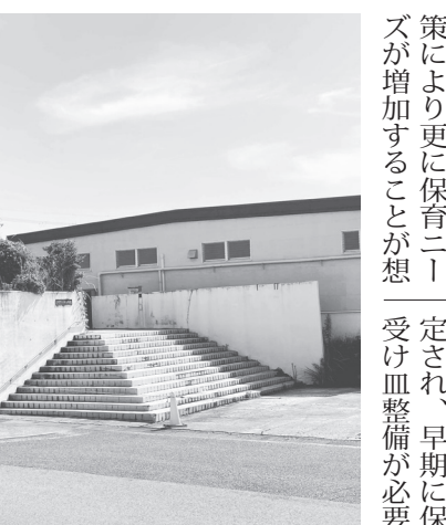
旧王寺幼稚園 (本町5丁目4番1号)

策により更に保育ニーズが増加することが想定され、早期に保育の受け皿整備が必要となる。定され、早期に保育の受け皿整備が必要となる。