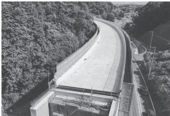
清水谷高架橋は9月末完成に向け、現在、排水設備などの整備を行っている