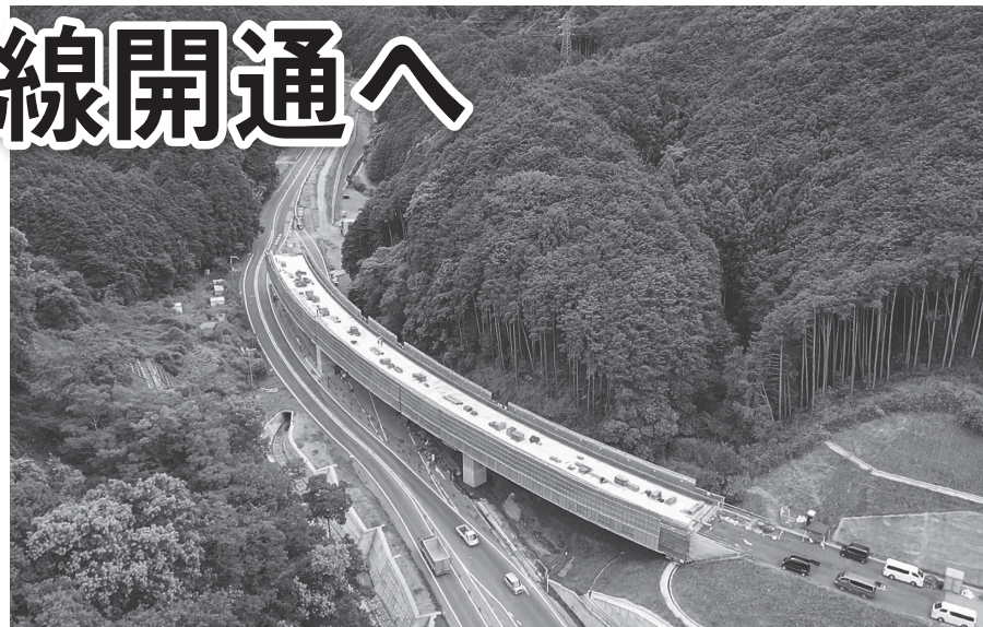
清水谷高架橋の建設が進む「高取バイパス」(撮影：令和5年6月)

「一般国道169号高取バイパス」は、京奈和自動車道へのアクセス向上、吉野地域等の利便性向上・活性化及び、大和平野地域の連携強化を目指し、国道169号を高取町清水谷から北西へ分岐し、同町兵庫へ至る路線。令和7年度の全線開通を目指して県土木マネジメント部が整備を進めており、「御所高取バイパス(平成29年事業化)」と一体で、直接「御所IC」につなぎ、紀伊半島アンカールートの一部を形成する路線として期待されている。