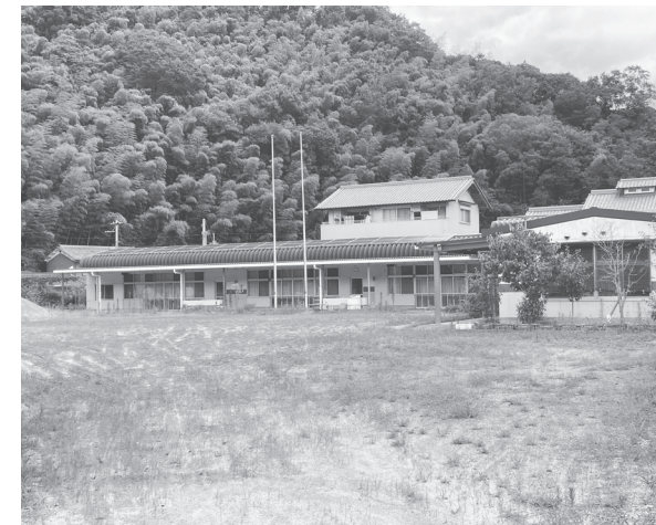
大淀西部幼稚園(今木779-4)

間が7月31日(8月9日、プレゼンテーション)を8月22日に実施する予定。委託期間は6年3月15日、委託費限度額は880万円。参加資格は▽測量・建設コンサルタント等において調査、都市計画、分析解析▽公告日から過去5年以内において国、地方公共団体