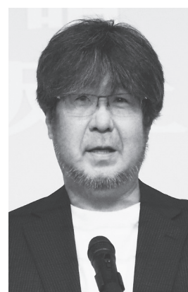
崎請会・坂上会長