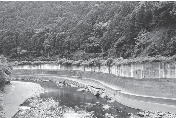
落石防止網の整備を予定する「国道169号」(下多古)