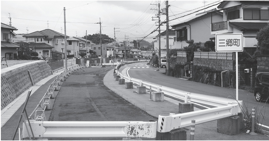
整備の進む「椿井王寺線」