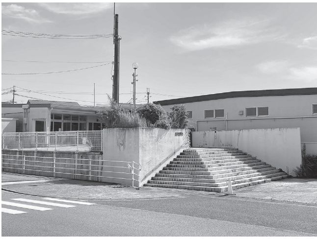
旧王寺幼稚園 (本町5丁目4番1号)

王寺町は、公募型プロポーザルにて「王寺町民間幼保連携型認定こども園」の事業者を募集している。応募書類の受付が7月31日まで、プレゼンテーションを8月9日に実施し、審査結果を8月10日に通知する。こども園の開園は令和7年4月1日を予定。同町ではこれまで、