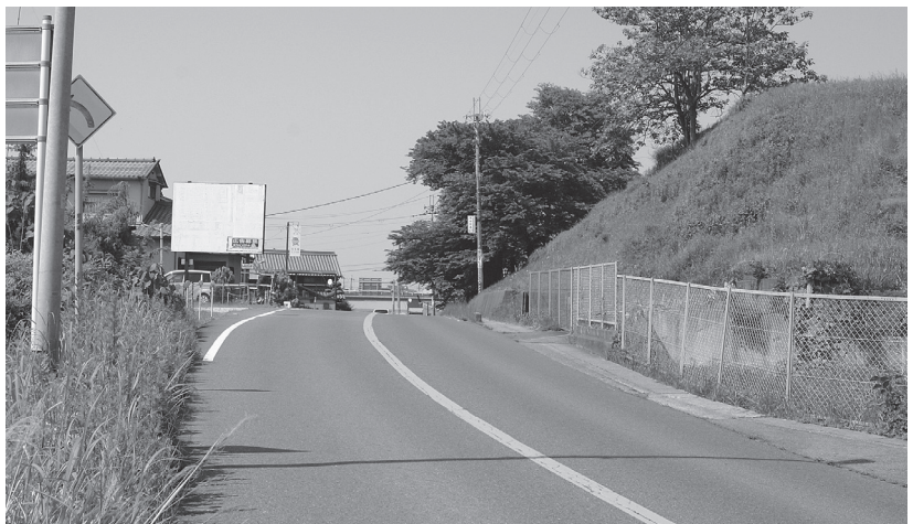
整備予定の国道169号 (大軽町)