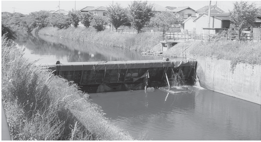
整備を予定する井堰 (秋篠川)