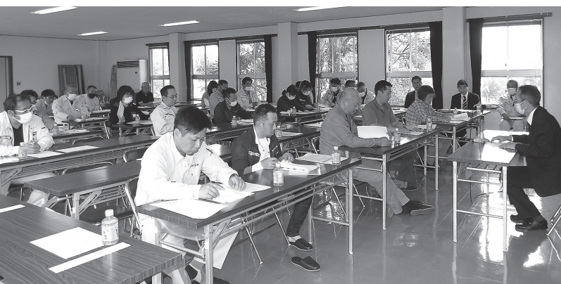
令和5年度事業計画など全会一致で承認した