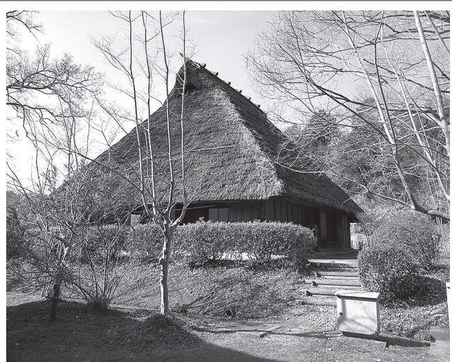
奈良県立民俗博物館旧岩本家。写真は旧岩本家の外観。木造茅葺平屋建桁行13・89尺梁間11・07尺入母屋造平面積159・797平方尺(屋根面積415・7平方尺)。