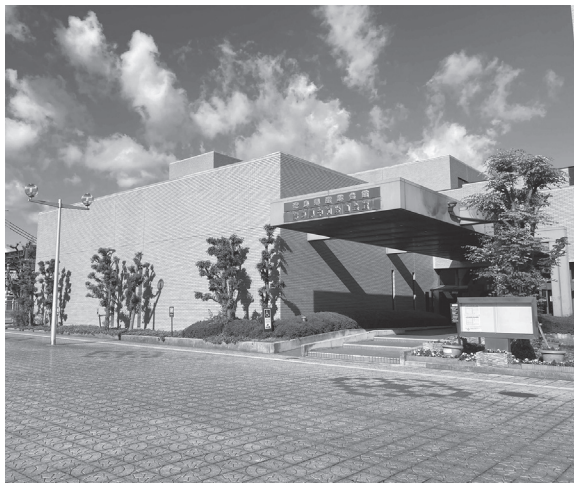
移転候補地となっている県産業会館(幸町2-33)

大和高田市は「大和高田市立病院新病院整備基本構想(案)」を作成した。同構想(案)について、意見を6月25日まで募集している。構想(案)は市のホームページで公表するとともに▽市立病院▽市役所▽中央公民館市立図書館▽市民交流センター(コスモスプラザ)▽葛城コミュニティセンターでも閲覧に供す。