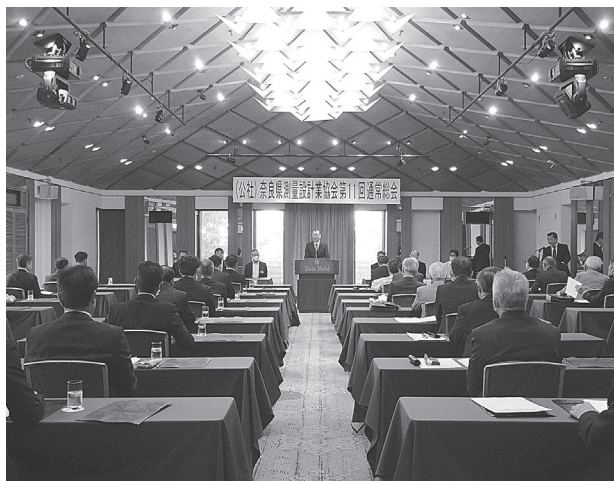
盛大に開催された通常総会(5月15日、奈良ホテル)

が拒否すれば予算が付かない。県を良くするために、しっかりと取り組んでまいりたい」とそれぞれが祝辞を述べた。 続いて表彰に移り、入会後10年以上の会員の元で20年以上永年勤続し、勤務成績が優秀な職員5名を表彰した。議事に移り、4年度決算、入会金と会費の額の据置などを承認。4年度事業・5年度の事業計画と収支予算などを報告し、最後に測量の日々の事業などの案内を行なった。