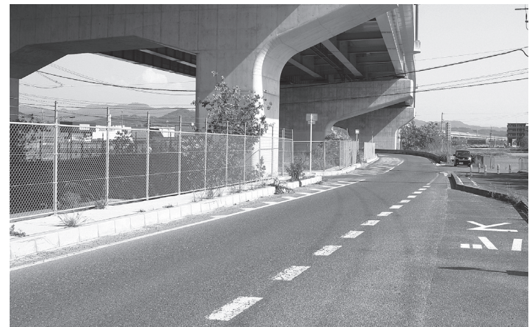
「檀原高取線」北行き車線

更新を行うもの。整備概要は、工事延長180メートル、切削オーバーレイ工。発注は第2四半期の予定で、工期は約4カ月を見込んでいます。当該区間は、檀原高田JETの南に位置しており、商業施設の多いエリアで、国道24号からの幹線道路としての利用車輦だけでなく、付近住民の生活道路としての利用も多い。また、檀原高田JET及びその北側では大和御所道路の整備が進んでおり、今後交通量の増加が予想されるエリアでもある。県は、生活に密着したインフラとして、道路の整備、メ