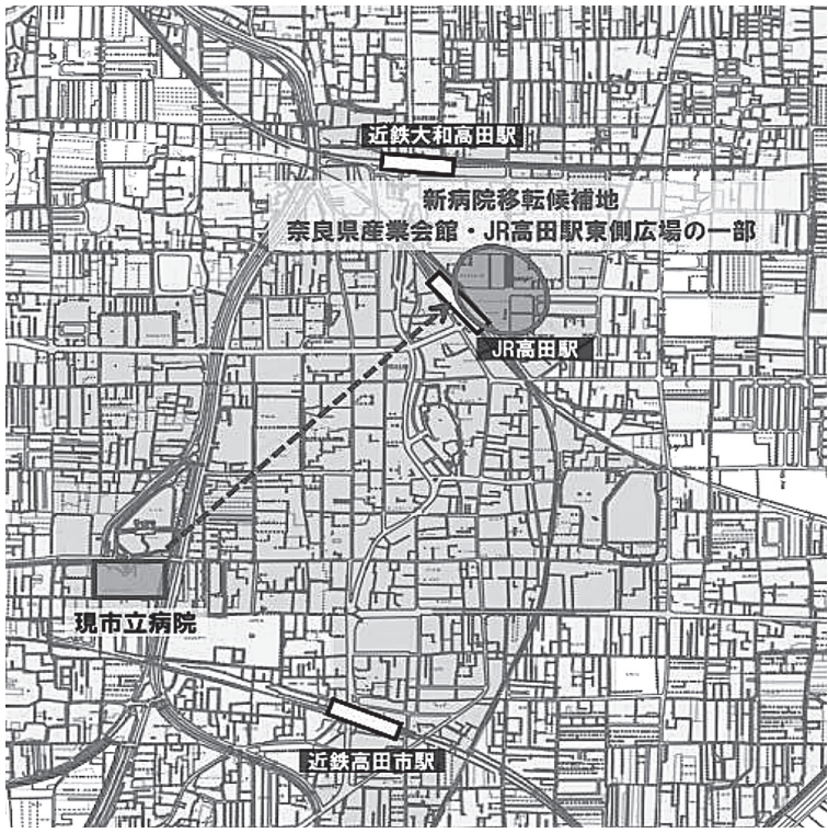
現病院と新病院移転候補地周辺図

意見の提出は持参。郵便・FAX・電子メールのいずれから提出が可能。問い合わせ先は市立病院財務企画課(電話0745-5312901)。