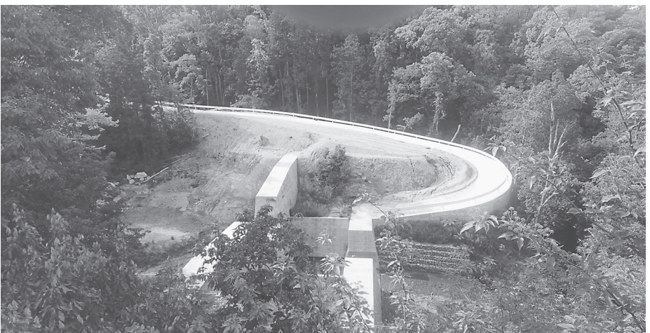
砂防堰堤管理用道路の法面などを整備する