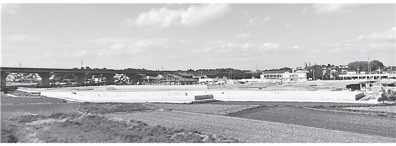
今年度末の完成を目指す中町「道の駅」

奈良県奈良土木事務所は、中町「道の駅」の整備を進めており、今年度、複数の工事を発注する意向で、5月8日に公告されたバスターミナルなどに設置される通路シエルトの整備で本日(18日)に入札参加申込書の提出が締め切られる。中町「道の駅」施設工事(工事概要、工事延長98㍍、通路シエルト