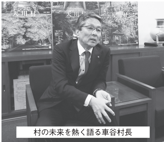
村の未来を熱く語る車谷村長