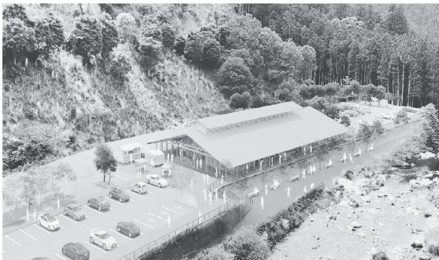
洞川温泉ビジターセンター完成予想図