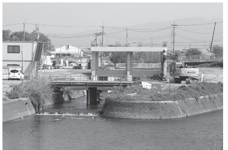
樋門本体工事は間もなく完成

流路延長約3キロの一級河川で、地域の水害に対する安全・安心を確保するために平成21年度から河川改修に着手している。洪水を安