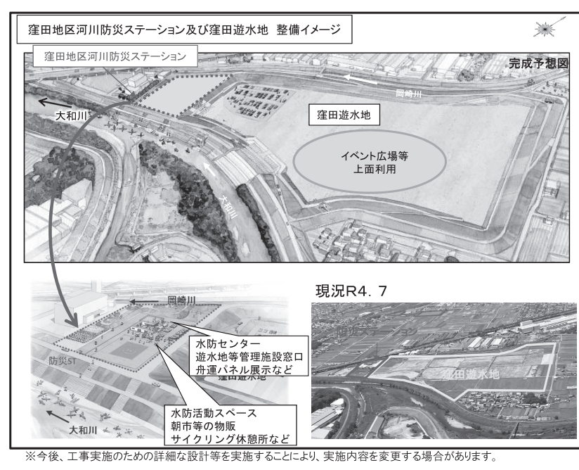
窪田地区河川防災ステーション及び窪田遊水地 整備イメージ 完成予想図 現況R4.7

近畿地方整備局道路部は、4月25日に公示した簡易公募型プロポーザル「近畿管内道路整備効果分析業務」に係る参加表明書を5月12日まで、技術提案書を6月7日まで受け付ける。説明書等は5月12日まで交付する。業務は、近畿管内の交通量推計及び費用便