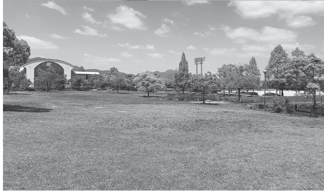
◀ 移転先予定地の市の総合公園