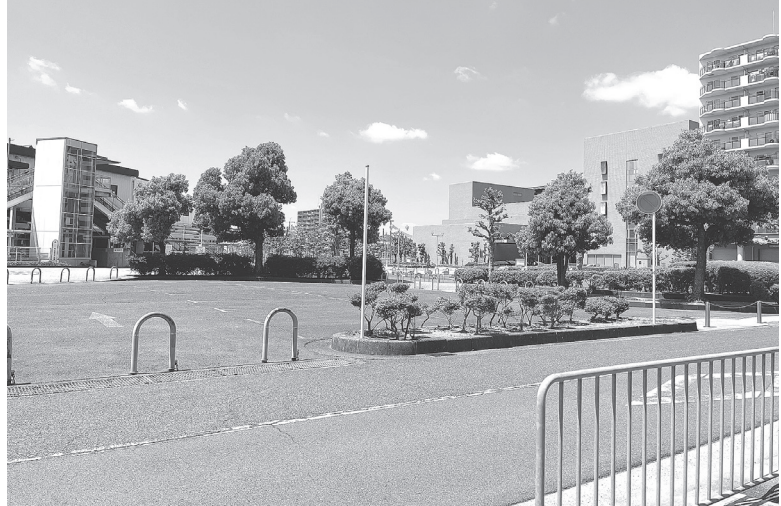
▶ 移転候補地のJR高田駅東側