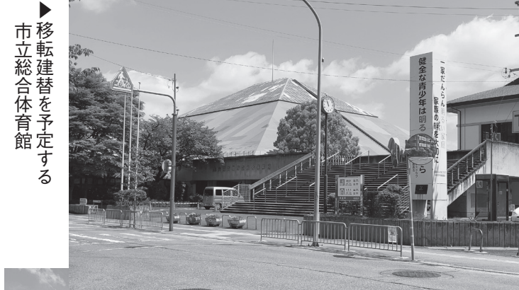
▶ 移転建替を予定する市立総合体育館