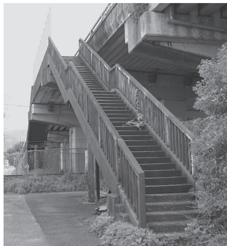
補修を予定する歩道橋(標本)

奈良県奈良土木事務所は、「天理環状線橋梁補修工事」として、歩道橋の補修を予定している。