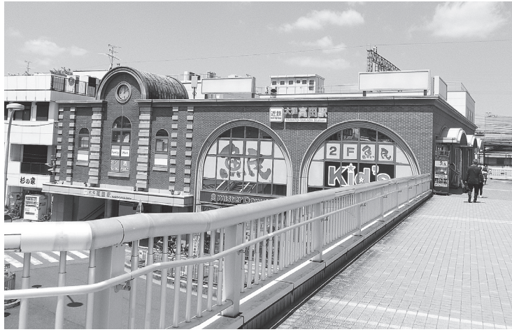
市の北の玄関口・近鉄大和高田駅