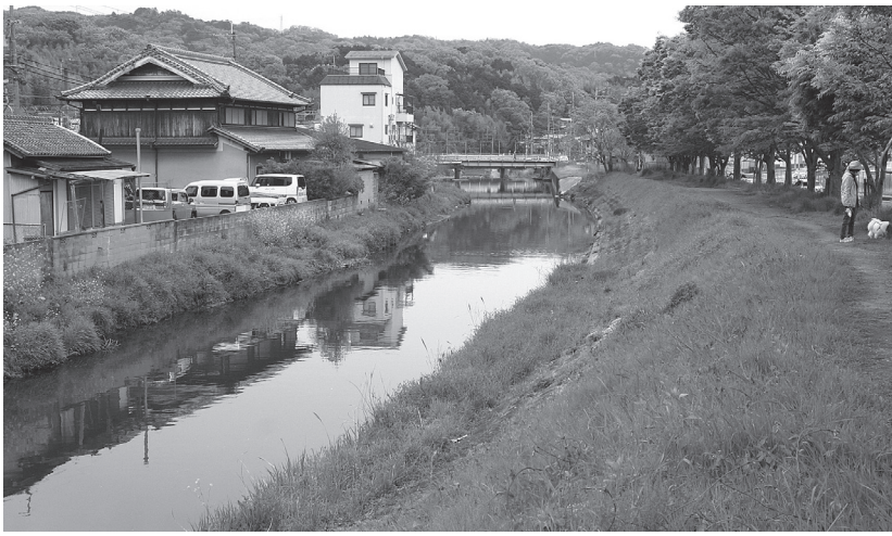
護岸整備を予定する竜田川