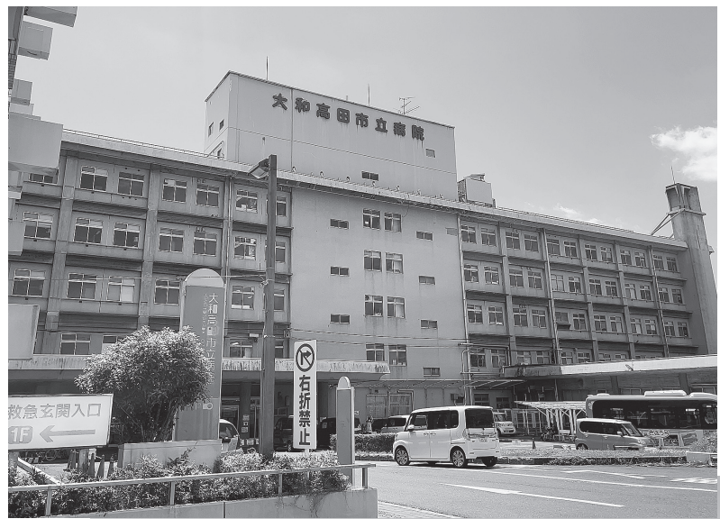
◀ 耐震化が急がれる市立病院