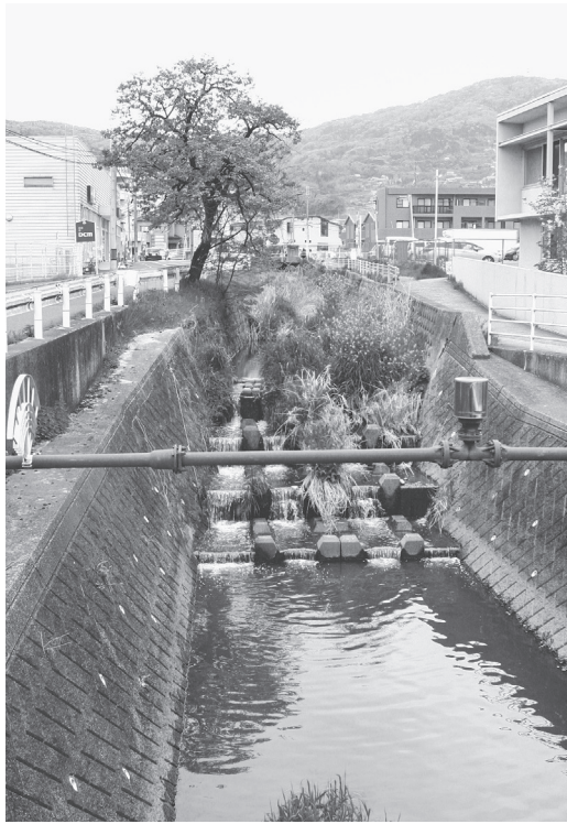
河道掘削を予定する「神田川」

奈良県郡山土木事務所は、神田川河道掘削の発注準備を進めている。神田川は、生駒市南部、暗峠から国道308号暗越奈良街道にそって東へ下り、竜田川右岸に注ぐ一級河川。同工事は、同河川の竜田川との合流部付近、小平尾町・小瀬町及び、萩原町において、流下能力を高めるため、浚渫を行うもの。第2四半期に発注を行う予定で、工事概要は、小平尾町・小瀬町・萩原町ともに、河道掘削