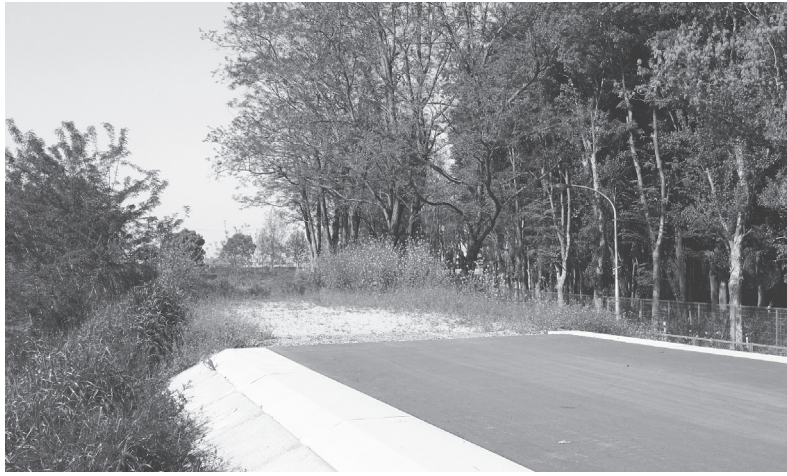
上部の補強を予定する高田川右岸堤防

奈良県高田土木事務所は、高田川河川改修を推進しており、堤防補強工事の発注を予定している。同工事は、河合町長楽(廣陵町)において、第二浄化センターの西側の高田川右岸堤防を補強するもの。土堤であった同堤防の天端に舗装を張り、法肩