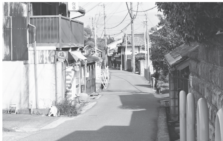
舗装の更新を予定する「天理王寺線」(旧道)