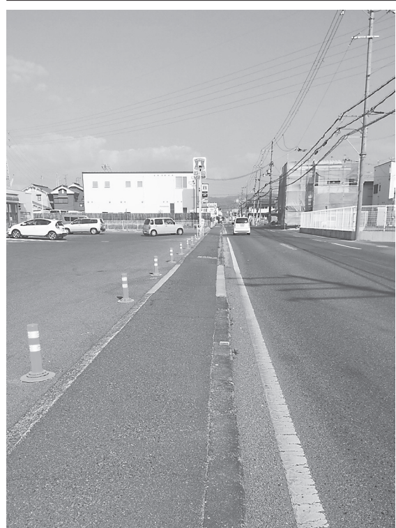
歩道の切り下げを行う「田原本広陵線」

年度整備された田原本町三笠(工事延長219m、緑石工178m)設計・大和測量設計事務所)に引き続き整備を行うもの。現在、第2四半期の発注を予定している。 マウントアップ型歩道の切り下げは、近年、「高齢者、身体障害者等の公共交通機関を利用した移動の円滑化の促進に関する法律」(いわゆる「交通バリアフリー法」)が施行されるなど、高齢者、身体 において、昨年度行った歩道の整備に引き続き、今年度では田原本町薬王寺の延長400mを整備する予定で準備を進めている。 工事は、マウントアップ型だった歩道の切り下げを行うもので、昨 うことで、段差を緩和し、また、マウントアップ形式のように、歩道に車両乗入れ部を設ける必要がなくなり、十分な平坦部をより広く確保することが可能だ。 田原本広陵線は、田 原本町三笠と広陵町足相を結び、沿線は住宅地が多く通学路としても利用される。また、通勤の時間帯など、車両の利用が多い路線でもある。歩道の切り下げを行うことで、歩行者の安全性、利便性の向上が見込まれ、円滑な通行への寄与が期待される。