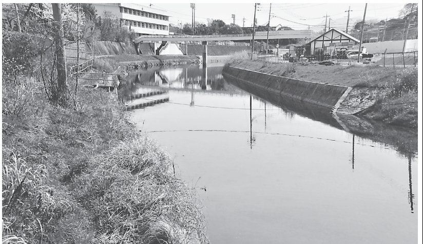
右岸側橋台の発注を予定している1号橋予定地

整備を進めており、第1号橋及び、小瀬町南交差点との接続部に当たる2号橋で、それぞれ左岸側の橋台の施工を進めている。また、1号橋と2号橋の明り部は盛土工、擁壁工などが進められており、線形が見える状態となっている。 2号橋の左岸側橋台(工事延長16m、橋台工1基、護岸工208平方m)は、7月末の完成予定で、同事務所では、右岸側の橋台整備も視野に入れ計画を推進している。また、道路部は橋梁が完成し てから本格的に工事を進める方針だ。 同路線の整備により、慢性的に発生している「小瀬町西」、「小瀬町南」交差点での渋滞や、渋滞を避ける車両の通学路への流入の減少、また第二阪奈有料道路へのアクセスと南北方向交通の円滑化、救急搬送の円滑化に寄与が期待されている。