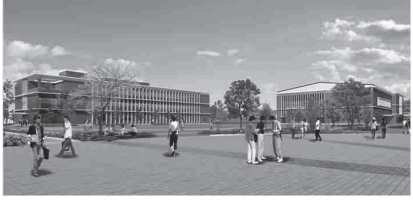
〈イメージ〉三宅町に整備予定の新キャンパス

維持対応・除草等の包括管理、道路照明のLED灯の維持管理②道路メンテナンス課。 ▽大和西大寺駅高架化・近鉄奈良線移設検討事業(125、000) ①地方踏切道改良計画に基づく計画の検討として鉄道概略設計ほか②まちづくりプロジェクト推進課。 ▽鉄道駅バリアフリー整備事業(145、384) ①鉄道駅における段差解消等のバリアフリー整備を行う鉄道事業者に対して補助(エレベーターはJR香芝駅と近鉄平城駅、スロープは近鉄耳成駅と近鉄五位堂駅)②リニア推進・地域交通対策課。 ▽リニア中央新幹線及びリニア中央新幹線・関西国際空港接続線調査検討事業(45、000) ①リニア中央新幹線「奈良市附近駅」の早期確定に向けた調査・検討(リニア中央新幹線の想定ルート等、新規に「奈良市附近駅」周辺のまちづくり)、リニア中央新幹線・関西国際空港接続線構想の具体化に向けた調査・検討②リニア推進・地域交通対策課。 健康やかな「都」をつくる健康長寿日本一を目標