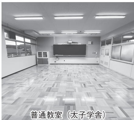
普通教室 (太子学舎)