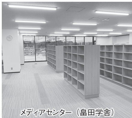
メディアセンター (畠田学舎)