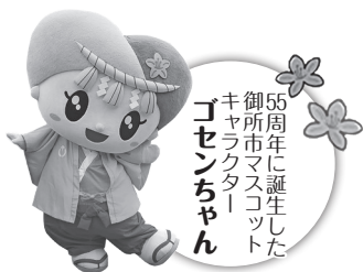
55周年に誕生した 御所市マスコット キャラクター 「ゴセンちゃん」