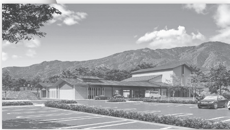
令和5年4月稼働予定の 「御所市斎場 かまきみの杜」 (イメージ図)