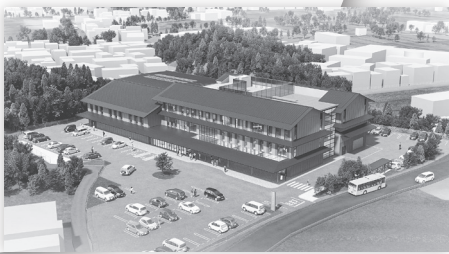
令和6年1月の供用目指す (仮称)御所市防災市民センター (イメージ図)