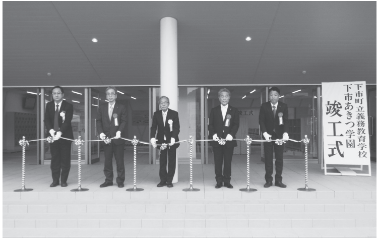
杵本町長(中央)ら関係者でテープカット(3月25日、昇降口前)

敷地面積1万3108平方メートルにRC造3階建、建築面積1822.15平方メートル、延床面積4835.30平方メートルの規模。街並みに調和する2列の切妻屋根や吹き抜けで温度差換気を生み出す風の塔が中央にそびえ、太陽光発電施設を備える。