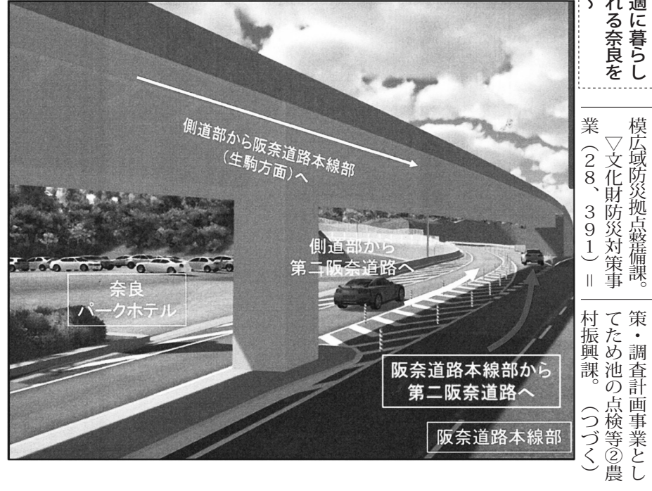
側道部から阪奈道路本線部(生駒方面)へ、側道部から第二阪奈道路へ、奈良パークホテル、阪奈道路本線部から第二阪奈道路へ、阪奈道路本線部