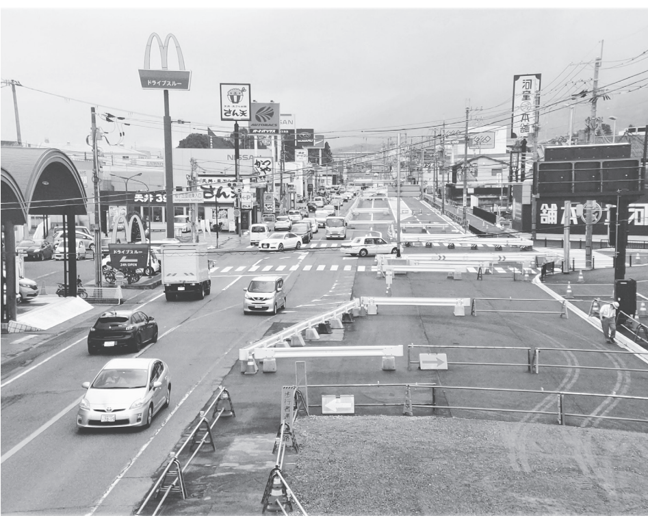
6年度の供用を目指す王寺香芝道路施工部