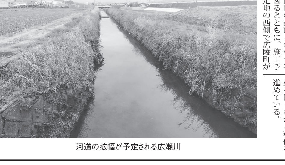
河道の拡幅が予定される広瀬川