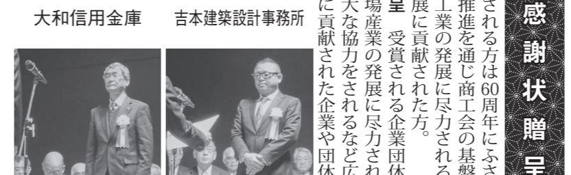
表彰・感謝状贈呈

表彰・感謝状贈呈 受賞される方は60周年にふさわしく事業の積極的な推進を通じ商工会の基盤確立に寄与され地域商工業の発展に尽力されるなど今日の商工会の発展に貢献された方。企業団体は地域商工業並びに地域産業の発展に尽力され商工会の基盤確立に多大な協力をされるなど、広く今日の商工会の発展に貢献された企業や団体。