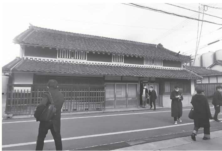
築150年の古民家を改装した蒸溜所

講すべき状態であると確認されたため、令和2・3年度に詳細設計を行い、2月1日より、