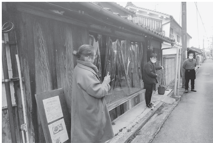
オーナー自ら施工を手がけたコミュニティースペース

「職住近接の御所町の町屋の特徴である、きちんと揃えられた表の造りから、奥の空間の自由さが見えるようなものにしていきたく」と自身の思いを述べた。その後、質問会が設けられ、強度計算の考え方など技術的なことや行政との関わりについてなど、活発な意見が飛び交った。