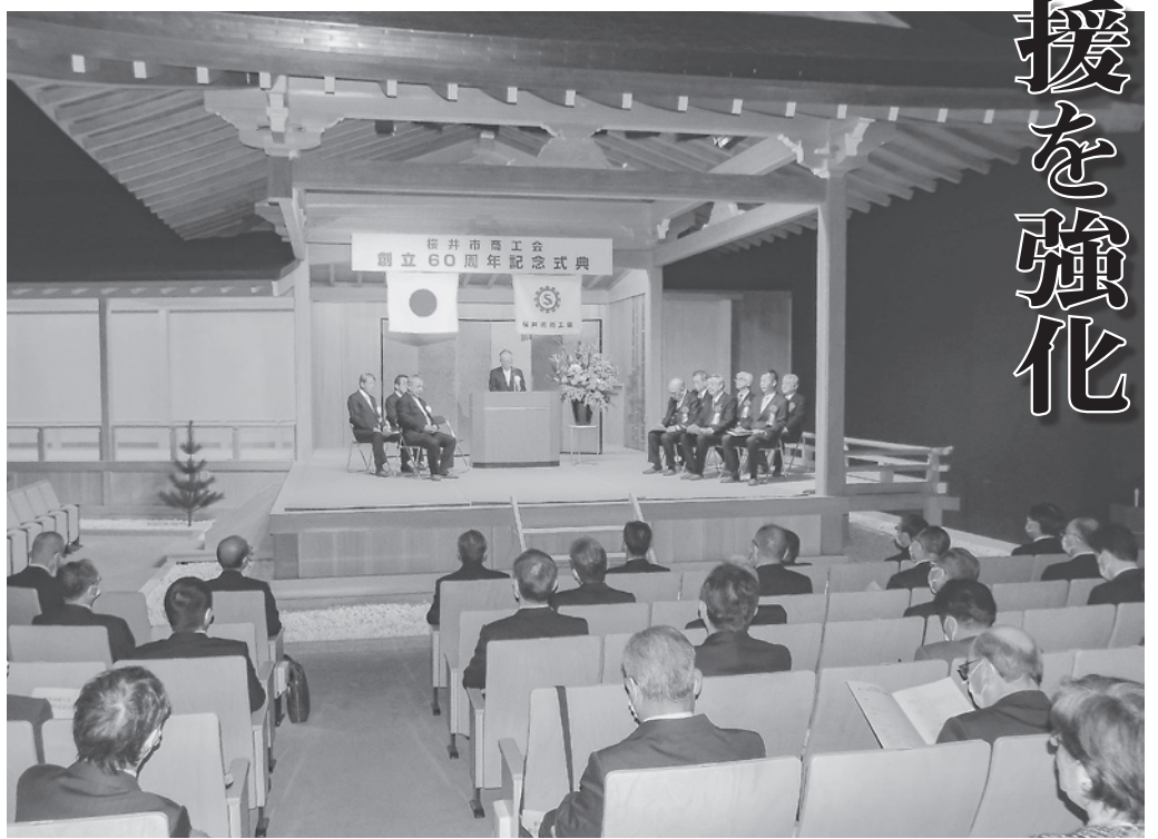
盛大に行われた記念式典＝1月21日、大神神社三輪山会館