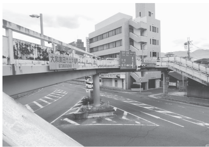
補修工事が行われる片塩歩道橋

講すべき状態であると確認されたため、令和2・3年度に詳細設計を行い、2月1日より、