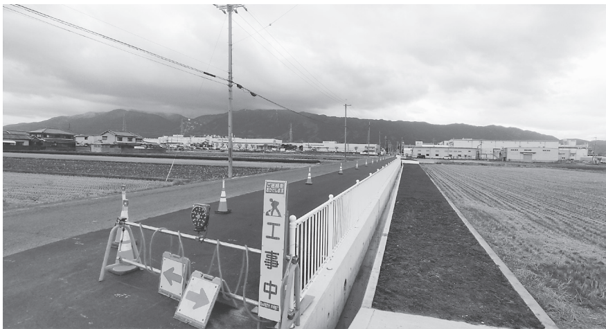
拡幅を行った「新町・柳原線」(2工区)