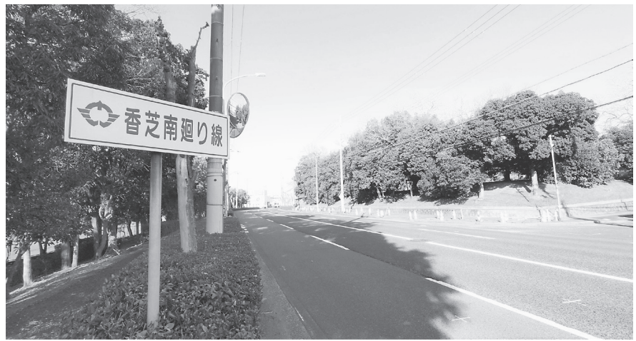
舗装維持工事に着工する「香芝南廻り線」

同工事は、同路線の 香芝市別所の三洋堂書 店・スギ薬局付近より 北に向かい約350mの 区間で傷んだ路面の 更新を行うもの。工事 概要は、切削オーバ レイ工4780平方 m、舗装打換工272