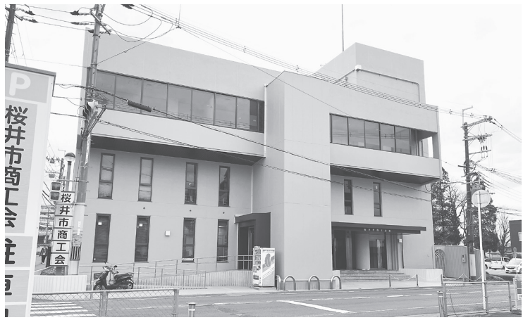
リニューアルした会館 (川合 260-2)