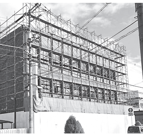
解体が行われている旧高田本町支店店舗

以降、老朽化した中央公民館や隣接する市立図書館、保健センターては昨年10月、大和高とを合わせた複合施設