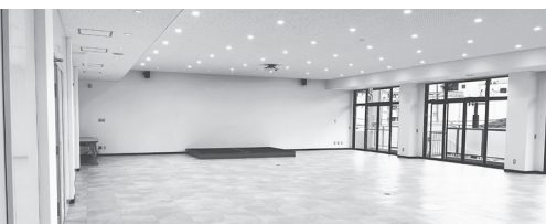
全面リニューアルした3F 大会議室

る運びとなった。 同会館は、地域商工 業と経済の発展を促進 すると共に、社会一般 の福祉の向上を図る目 的の昭和54年3月竣工 の館内には大小会議 室、研修室等も設けて おり、会員はもとより 商工業界及び、一般市 民も広く利用している。 耐震リニューアル工 事は、RC造本館4階 建、別館2階建、延床 面積1082.07平方 mの耐震補強、電気設 備、機械設備などの工 事を行い、耐震補強壁・ スリットの増床、外壁・ 屋上の再塗装や防水処 理のほか、3階大会議 室の床・壁、電気設備 (照明のLED化)、空 調設備を一新した。ま た、2階和室の洋室化 や各階トイレの乾式化