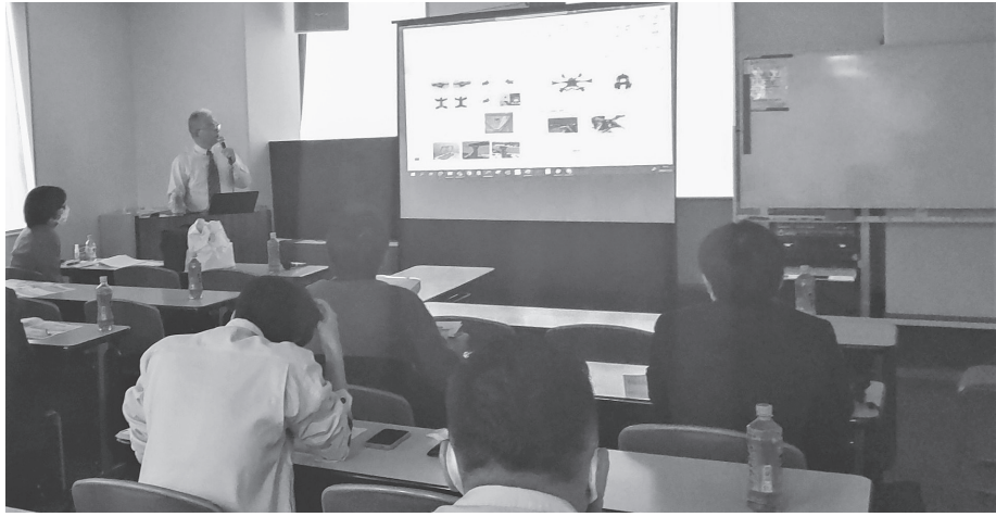
「橋梁点検」についての講義が行われた