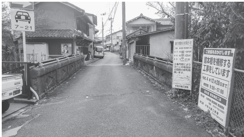
補修工事が行われている「鷺本橋」

11月24日の時点で、橋面を除いて足場で覆われた状態で、床版のコンクリートのひび割れ、断面修復などを終えている。設計時点から現状までの痛み