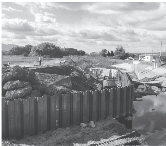
完成は5年6月末予定

奈良県中和土木事務所は、寺川護岸工事を進めている。寺川は、全長23キロメートル、流域面積70平方キロメートルの1級河川で、桜井市、橿原市、田原本町、三宅町と流れ川西町で大和川に合流する。同工事は桜井市大