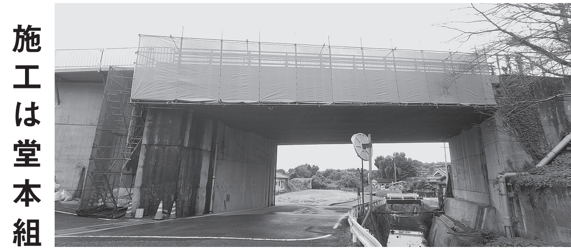
御所市と葛城市の市境に位置する兄川橋