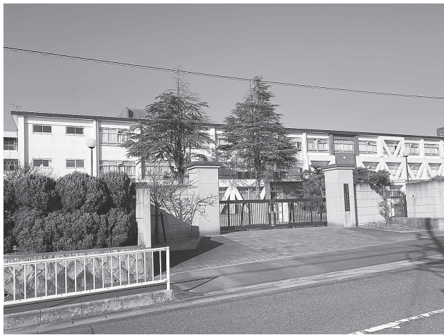
改築予定の一条中高一貫校(法華寺町1351)

札した一般競争入札 二条中高一貫校校舎改築その他工事」は村本・三和JVが28億9390万円(予定価格28億9897万円)で落札した。他の参加者はピーエス三菱・中村建設JV(辞退)。 建設JV(辞退)。 工事場所は法華寺町1351番地。工事概要は建築工事1式、電気設備工事1式、機械設備工事1式、昇降機設備工事1式。工期7年2月28日。