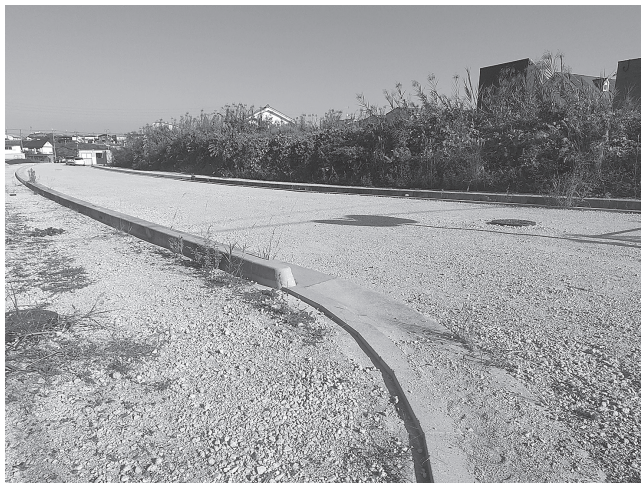
11月中旬に試掘作業を行う

を予定している。県は、戦前及び高度経済成長期に架橋された「高齢化橋梁」への対策を進めており、同事務所も、円滑な交通流を確保するため、対象橋梁の補修・補強対策を推進している。