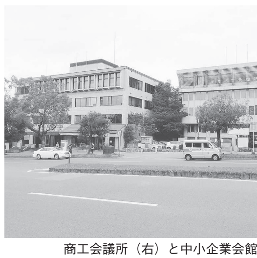
商工会議所(右)と中小企業会館

載、参加表明書を11月29日まで受け付けて業務実績について審査し、上位5社程度を選定し、技術提案書を12月11日まで受け付けて