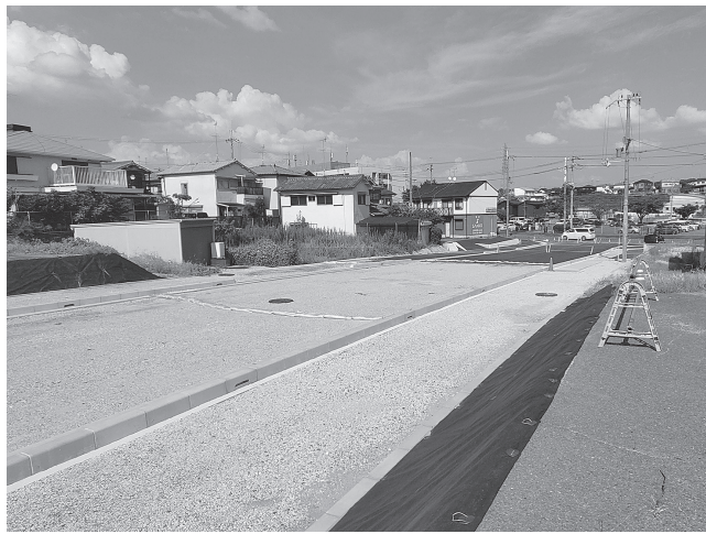
下牧高田線との接続部付近