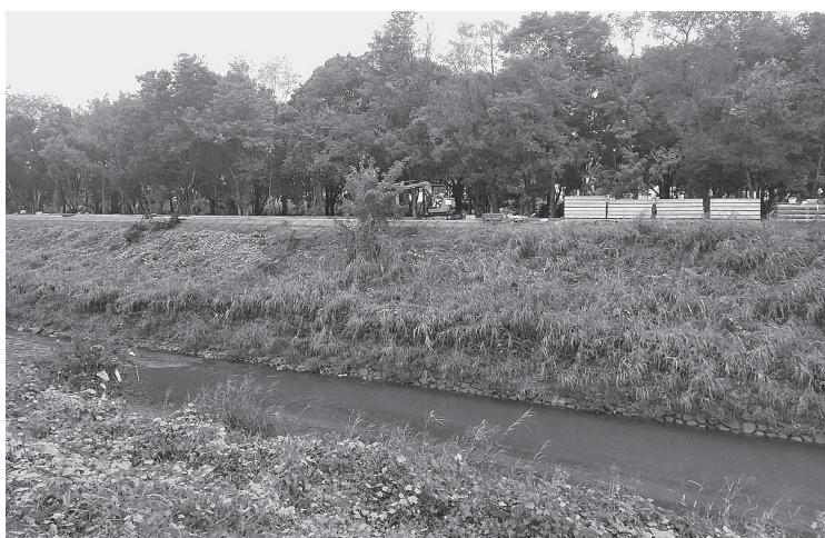
施工中の高田川堤防