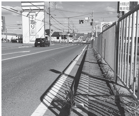
歩道整備を予定する筒井町交差点

「福住IC(天理東IC(名阪国道)」など各所に、道路改良・維持として、舗装や付属設備の再整備や道路の拡幅、歩道の設置など、安全対策工事を行うもの。現在、柏木町交差点北側で、「電線共同溝設置工事」と並行して道路改良の作業が進められており、今後、