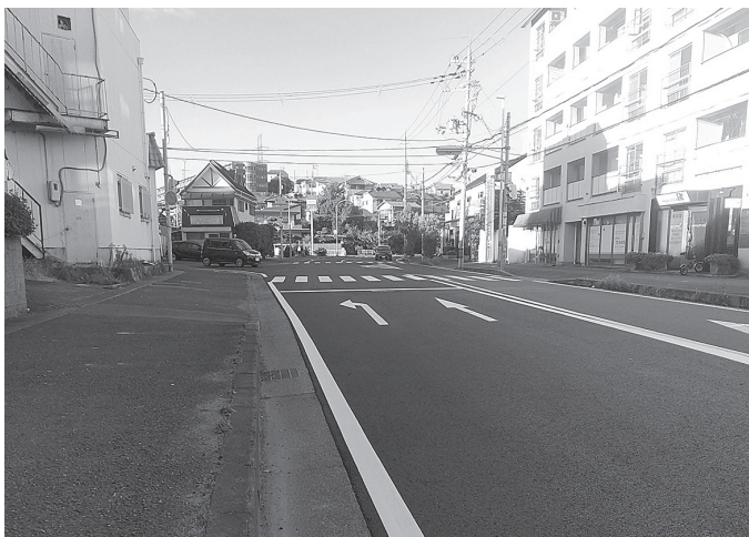
俵口町交差点付近

度は、「悪いところをなくしていく」として、一部予算要求を行い、生駒停車場宛木線の整備を推進してゆく方針だ。