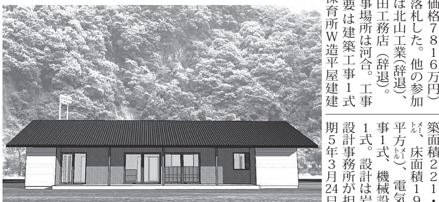
やまゆり保育園完成イメージパース

上北山村 上北山村が10月27日開札(議会議決後契約予定)した一般競争入札「やまゆり保育園新築工事第23号」は中尾組が7790万円(予