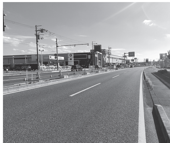
柏木町交差点付近

度は、「悪いところをなくしていく」として、一部予算要求を行い、生駒停車場宛木線の整備を推進してゆく方針だ。