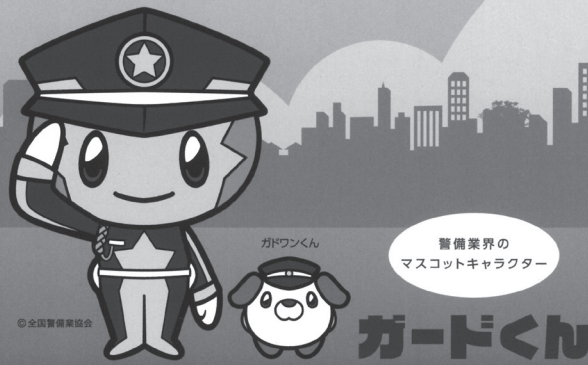
警備業界の マスコットキャラクター

警備業の全国組織「一般社団法人全国警備業協会」は「警備の日」を制定いたしました。 「警備の日」制定の目的は、社会の安全・安心への関心が高まる中で 役割がますます重要になっている警備業への理解と信頼を高めることにあります。 「警備の日」の日付は警備業法が1972年(昭和47年)11月1日に施行されたことにちなんでいます。