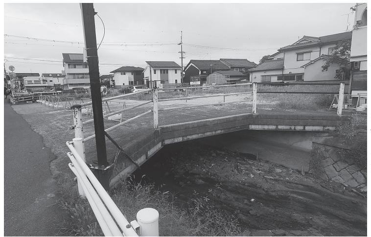
河川改修に伴い使用されなくなった橋も撤去される

は、工事延長67メートル、ブロック積護岸工349平方メートル。設計はノア技術コンサルタントが担当。完成は5年5月末日の予定。