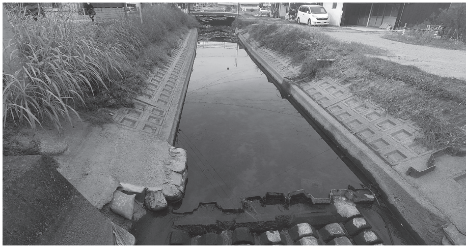
工事が予定されている「三代川」