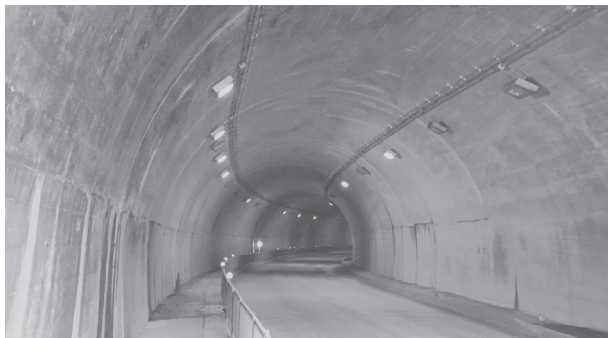
現在は「低圧ナトリウム灯」が使用されている

内の照明を低圧ナトリ ウム灯から、低消費電 力、長寿命のLEDへ 更新するもの。