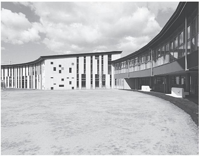
幼児教育の拠点「ゆめさとこども園」