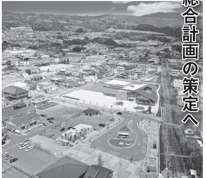
土地区画整理事業が完了し、町の玄関口として新たに生まれ変わった近鉄平群駅前

4月1日より「まち未来推進室」を設置いたしました。少子高齢化が進む中(高齢化率38・6%)、町の魅力を町内外へ発信し、更にその価値を高めていく取組を進め、若年層の移住や町内居住者の定住意欲を高め、人が集う未来あるまちづくりを目指してまいります。また、「経済建設課」を分離し、「観光産業課」と「都市建設課」を設置することにより、一層きめ細かな住民サービスに努めてまいります。