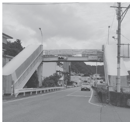
補修工事が行われている「上市歩道橋」

概要は、工事延長69 0m、デッキ工1カ所、 樹脂系滑り止め舗装1 219平方m、階段工。 設計はアーバンパイオ ニア設計、オオバが、 施工を赤木工業担当。 10月17日より立ち入り を制限して、本格的な 作業に入っており、5 年3月下旬の完成を目 指している。 また、今年度中には、 「園路舗装工事(斑鳩 町龍田)」「堂山園地周 辺公園施設整備工事 (斑鳩町稲葉車瀬・龍 田南)」などが予定さ れており、準備を進め ている。 同事務所は、今年度 に引き続き、来年度も 再整備計画を推進して ゆく方針で、左岸側の 設計などの発注を予定 している。