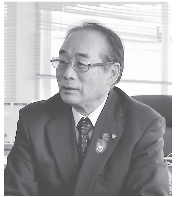
平群町 西脇 洋貴 町長

近代都市化の波を受けて大規模な宅地造成が行われ、人口増加が急増したことから集中的に公共施設の整備が進められた平群町。「緑豊かな心豊かな子どもがこころえるまち」を将来像に取り組む第5次総合計画の最終年度を迎え、次の10年間で目指すべき町の姿やその実現に向けた第6次総合計画の策定作業を進める西脇洋貴町長。4月より「まち未来推進室」を創設し、人口対策(定住促進)、シニアプロモーションの促進など、未来に向けた魅力あるまちづくりを進める西脇町長に町の現状を伺った。(聞き手 足田)