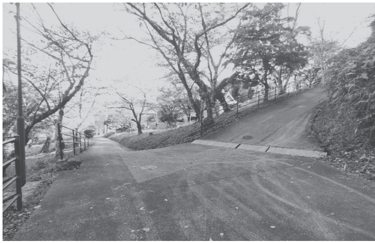
園路は樹脂系滑り止め舗装が施される