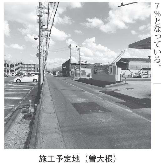
施工予定地(曾大根)