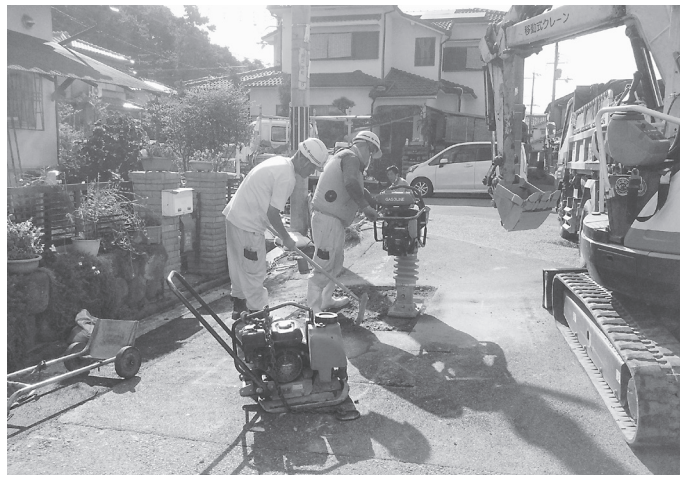
工事に先行しガス管の移設が行なわれた(蔵之宮町)