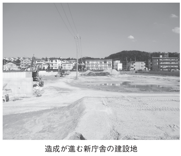
造成が進む新庁舎の建設地

県警察本部 奈良県警察本部は、9月29日開札の総合評価落札方式一般競争入札「生駒警察署新庁舎