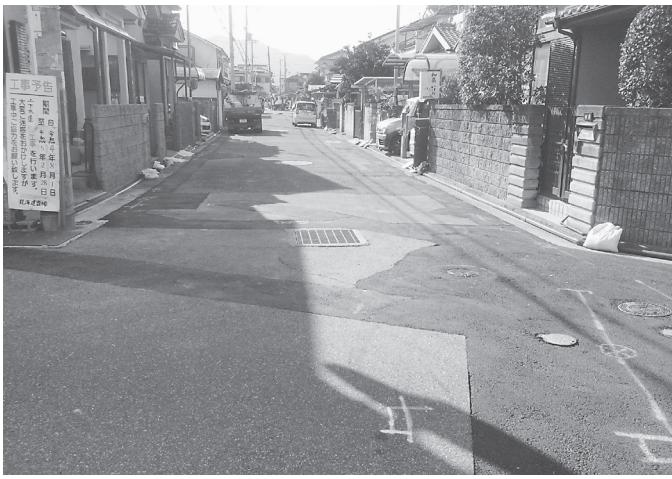
事業は10月中旬から(蔵之宮町)

要、管布設工φ200mm、L50・6m、マンホール工(1号人孔1基、取付管及び樹工1カ所、附帯工、GX形DIPφ150mm、L64m、