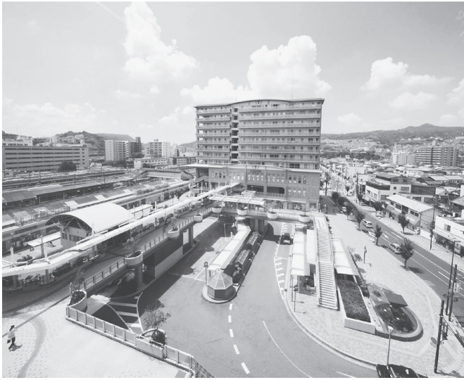
今後事業展開する王寺駅前北エリア

「人とまちがきらめく和(やわらぎ)のふるさと王寺」の実現をめざし、王寺町総合計画で掲げる6項目のまちづくりを進める平井康之町長。6月には王寺駅周辺地区(駅北エリア)まちづくり基本計画を策定し、西和地域の中核となる拠点機能の強化を進めるとともに、今後、駅南エリアについても議論を重ねる。また、王寺北・王寺南義務教育学校整備事業や国道25号の渋滞解消と国道168号の4車線道路による広域交通ネットワークの強化、葛下内水対策貯留池整備事業ほか、2037年予定のリニア中央新幹線開通を視野に入れたまちづくりについて平井町長に伺った。