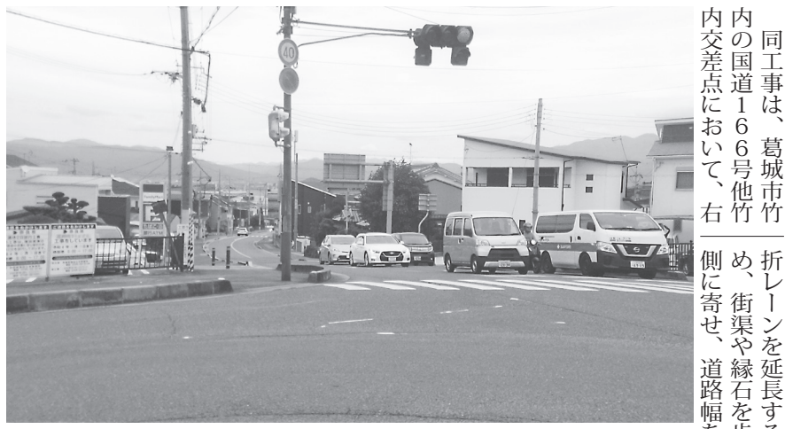
右折レーンが延長される竹内交差点

同工事は、葛城市竹内の国道166号他竹内交差点において、右折レーンを延長するたため、街渠や縁石を歩道側に寄せ、道路幅を確保するもの。今回の工事では交差点の東と北の2方向の工事が行われる。工事概要は、工事延長165m、管渠工195m、緑石工205m。設計は阪神コンサルタツツが、施工を成和興業が担当する。9月29日時点では、まだ工事には取り掛かっていないが、事前の測量などは行っており、近日中に作業に着手する見込みで、12月上旬の完成を予定している。竹内交差点は、国道166号と県道30号(山麓線)が交差する地点で、右折レーンの延長により、混雑時の右折待ち渋滞の緩和が期待される。