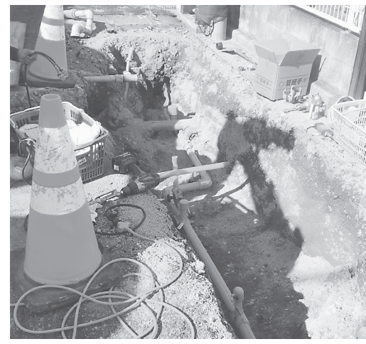
管渠工事(15)給配水管移設工事(G15)(甘田町)