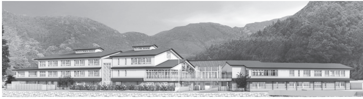
木造の教育学校完成イメージ図

川上村が8月30日開札した一般競争入札「川上村保育園並びに義務教育学校新築工事第1号」は、大日本土木が2億9368万円(設計金額2億7574万円)で落札した。他の参加者は森下組、村本建設、大和ハ