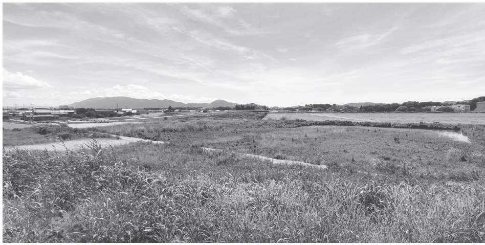
「保田遊水池」予定地