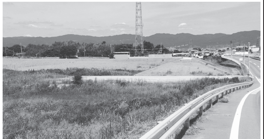
道路の左側に周囲堤と内水取込樋門が築かれる

につづき、公園西側の駐車場付近の、ローラースライダー、ターザンロープなどの老朽化した遊具を撤去し、新しいものに更新するとともに、周辺を整備するもの。遊具や設備は、撤去前と同様の形で更新され、工事に伴う変更はおこなわない。工事概要は「基盤整備」敷地造成工、施設撤去工【施設整備】遊戯施設整備工(複合遊具(小)、ローラースライダー、ターザンロープ、2連ブランコ、説明板1基、わら芝185.1平方メートル、仮設工)。設計はオオバが、施工を西谷建設が担当し、9月中旬に着工する見込みで、12月末の完成を目指す。この工事で葛城山麓公園の遊具更新は完了する。