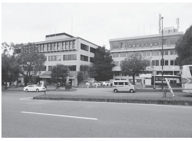
奈良商工会議所会館(右)と奈良県中小企業会館の現況

奈良県産業・観光・雇用振興部企業立地推進課は、奈良県中小企業会館と奈良商工会議所の今後の一体的・総合的な活用について、「奈良県中小企業会館等活用検討委員会」(委員長・中山徹奈良女子大学大学院教授)から「上質なホテルが望ましい」とする