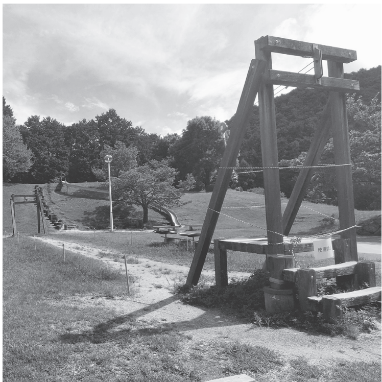
遊具は新しいものに置き換えられる