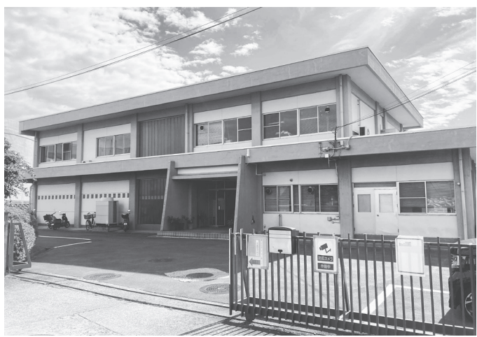
現水道庁舎(米山台6丁目7-1)

工事場所は大字服部台。工事概要は道路土工1式、アスファルト舗装工1式、雨水管付替工1式、仮設土工1式、区画線工1式、小構造物工1式、取壊し・撤去工1式。設計はセイワコンサル、天理技研が担当。工期5年3月31日。