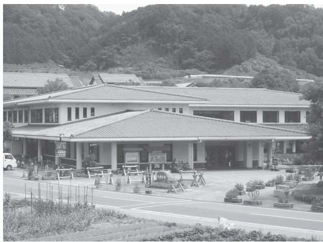
移転先の健康福祉センターたちばな

明日香村が7月12日開札(7月14日契約)した一般競争入札「令和4年度第209号明日香村図書室設計業務委託」は礎建築事務所が598万円(入札書比較価格770万円)で落札、業務を委託した。他の参加者は中和設計、福井建築設計事務所。