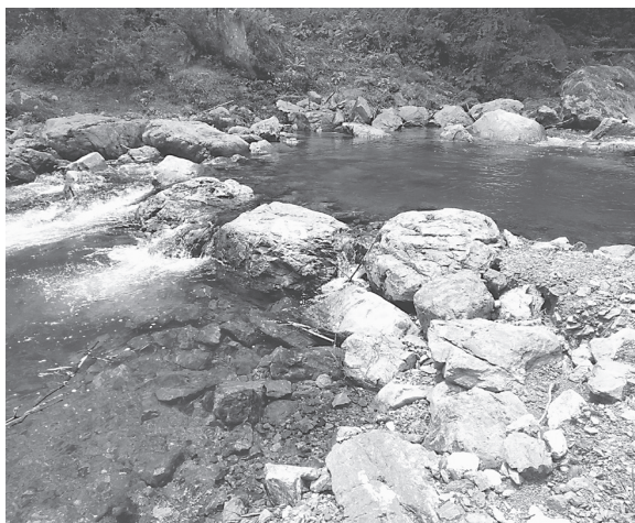
付近は溪流釣りなどが楽しめる観光スポット

高原川は、吉野川の支流で、川上村高原を流域に、大滝ダムに流れ込む河川である。同工事は、高原川の「高原川木地ヶ森溪谷釣り場」付近の護岸が、出水により補修が必要となったため行われた。工事概要は、工事延長37㍍、コンクリートブロック積工229平方㍍。設計は大和測量設計事務所が、施工を中平建設が担当した。高原川は、水質が良く、バーベキューやアゴ・マスなどの放流釣り場などが楽しめる管理渓流釣り場などが整備されており、気軽に渓流に親しめる観光スポットと