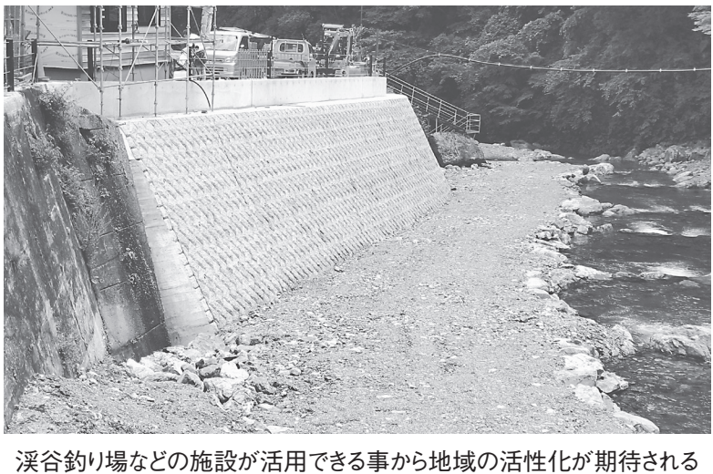
渓谷釣り場などの施設が活用できる事から地域の活性化が期待される

要は、【立岩橋】工事延長20・0㍍RC床版工2立方㍍、伸縮装置設置工9・1㍍、支取替工6基、桁補強材取替工4部材、橋梁塗装工156平方㍍、橋面防水工89平方㍍、アスファルト舗装工100平方㍍【新西河橋】工事延長20・8㍍伸縮装置取替工23・9㍍、