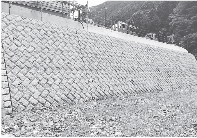
法面、護岸の破損などによる危険性がとり除かれた