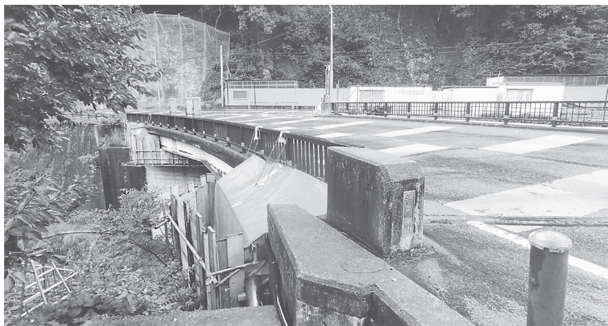
法定点検で「早期に措置が必要」と判定

交差する音無川に架かる橋梁で、架設年度が両橋とも1972年と、建設されてからちょうど半世紀が過ぎている。「奈良県橋梁長寿命化修繕計画」の計画対象橋梁となっており、5年ごとの定期点検で早期に措置が必要とされ、補修の対象と