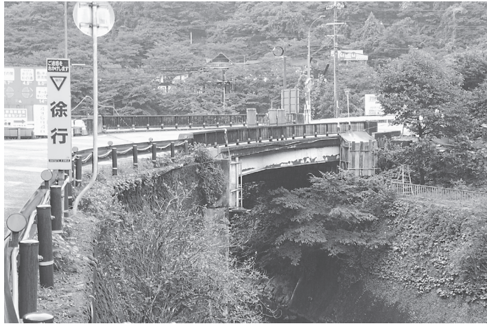
音無川に掛かる新西河橋

なっていた。同工事の完成で、護岸の破損による危険性が除かれた事に加え、現在臨時休業となっていた「高原川木地ヶ森溪谷釣り場」などの施設がリニューアルオープンに向けて整備を進めていることから、観光