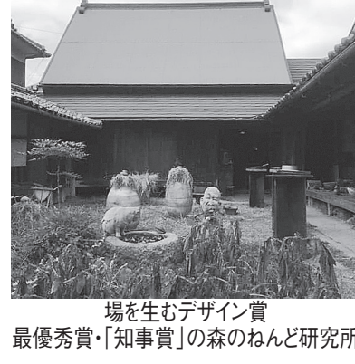
場を生むデザイン賞 最優秀賞・「知事賞」の森のねんど研究所

昭和59年度から隔年実施している「奈良県景観デザイン賞」を見直し、「場を生むデザイン賞」として昨年より実施。建物単体ではなく、地域社会と